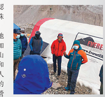
●珠峰不少登山者患上新冠。

據BBC訪問多名珠峰基地營的登山者和官員，他們透露至今已經從加德滿都的醫院，收到最少17宗登山者下山後確診的報告，更已經有登山者從基地營和更高海拔的營地被送院；加德滿都一家私人診所亦證實，曾經接獲從珠峰基地營折返的登山者確診個案。許多登山者表示，基地營缺乏新冠病毒檢測設施，尼泊爾政府也拒絕提供。