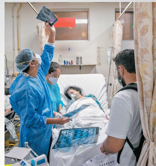
●新德里病人在醫院接受治療。