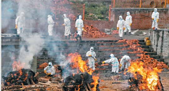
●尼泊爾也出現空地燒屍。