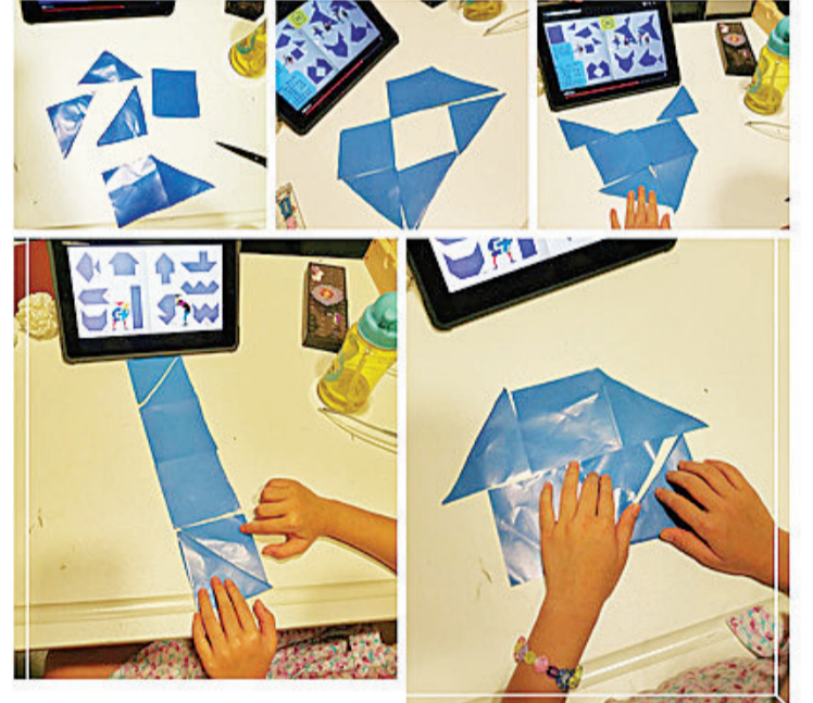
数学闯关活动:有趣的几何图形可训练逻辑与创意

【本报讯】“幼小衔接”是指孩子于学前阶段与小学阶段的过渡期衔接,对处于幼儿园毕业即将迈向小学阶段的幼生而言,是一个成长过程的重要转折,对于提高教育质量具有重要的意义。在幼儿园阶段主要是以游戏和能力发展为主的教育方式,而小学阶段则是以正规课业和静态知识的学习为主,于不同的教育方式需要幼生身心的调整来适应,这也是“幼小衔接”主要的目的。 雅加达台湾学校(Jakarta Taipei School)幼儿园在每年4月,都会安排长达一整周的“幼小衔接周”活动,除了带领幼生参访小学部校园认识将来的学习环境