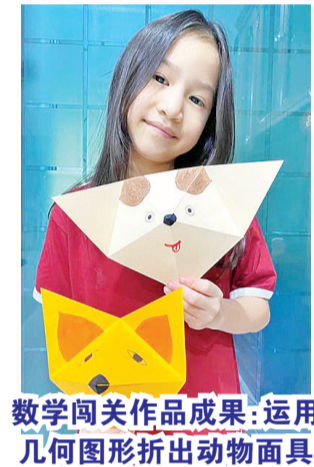
数学闯关作品成果:运用几何图形折出动物面具