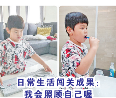
日常生活闯关成果:我会照顾自己喔