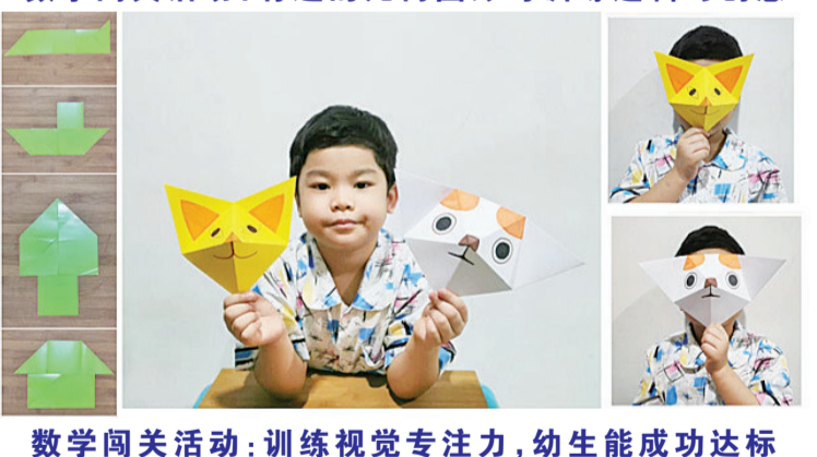
数学闯关活动:训练视觉专注力,幼生能成功达标