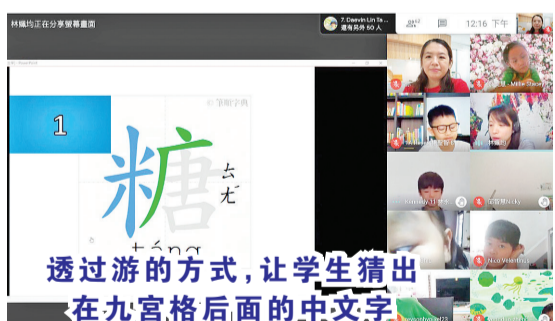
透过猜字的方式,让学生猜出在九宫格后面的中文字