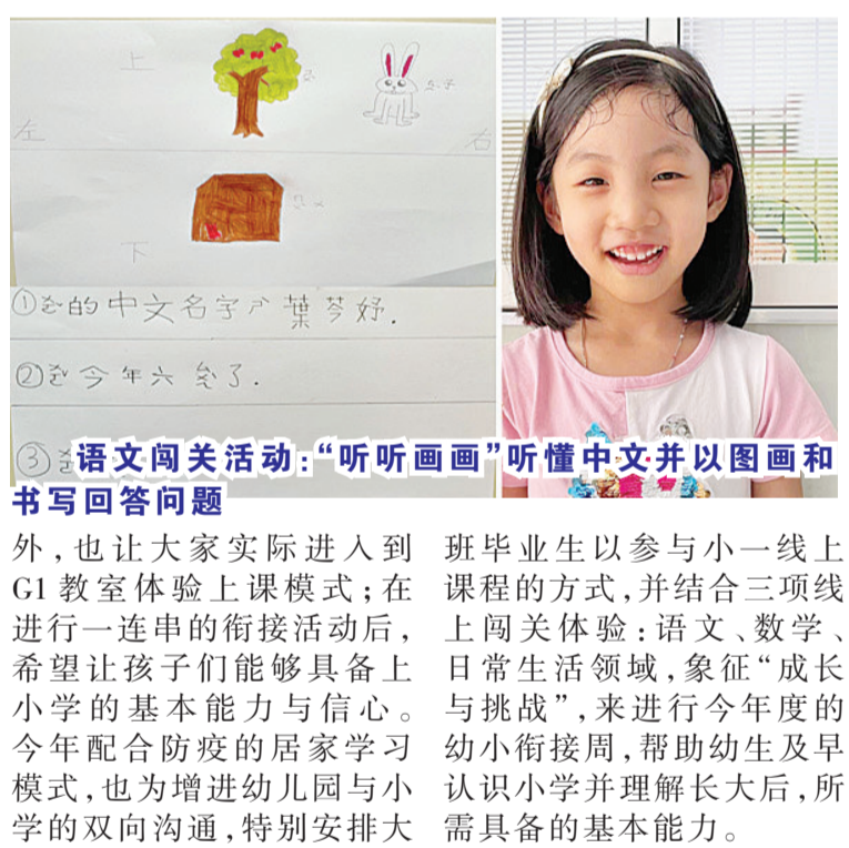
语文闯关活动:“听听画画”听懂中文并以图画和书写回答问题

【本报讯】“幼小衔接”是指孩子于学前阶段与小学阶段的过渡期衔接,对处于幼儿园毕业即将迈向小学阶段的幼生而言,是一个成长过程的重要转折,对于提高教育质量具有重要的意义。在幼儿园阶段主要是以游戏和能力发展为主的教育方式,而小学阶段则是以正规课业和静态知识的学习为主,于不同的教育方式需要幼生身心的调整来适应,这也是“幼小衔接”主要的目的。 雅加达台湾学校(Jakarta Taipei School)幼儿园在每年4月,都会安排长达一整周的“幼小衔接周”活动,除了带领幼生参访小学部校园认识将来的学习环境