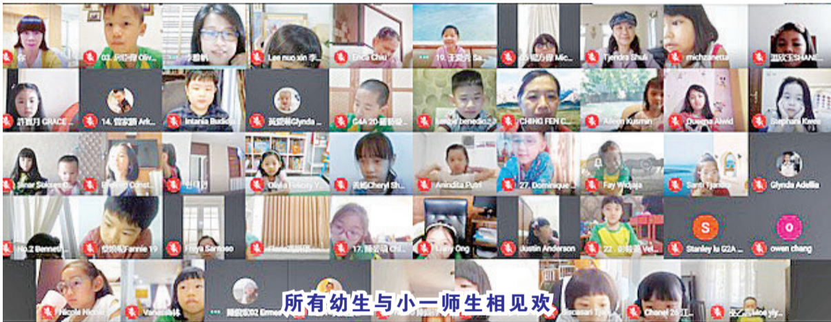
所有幼生与小一师生相见欢