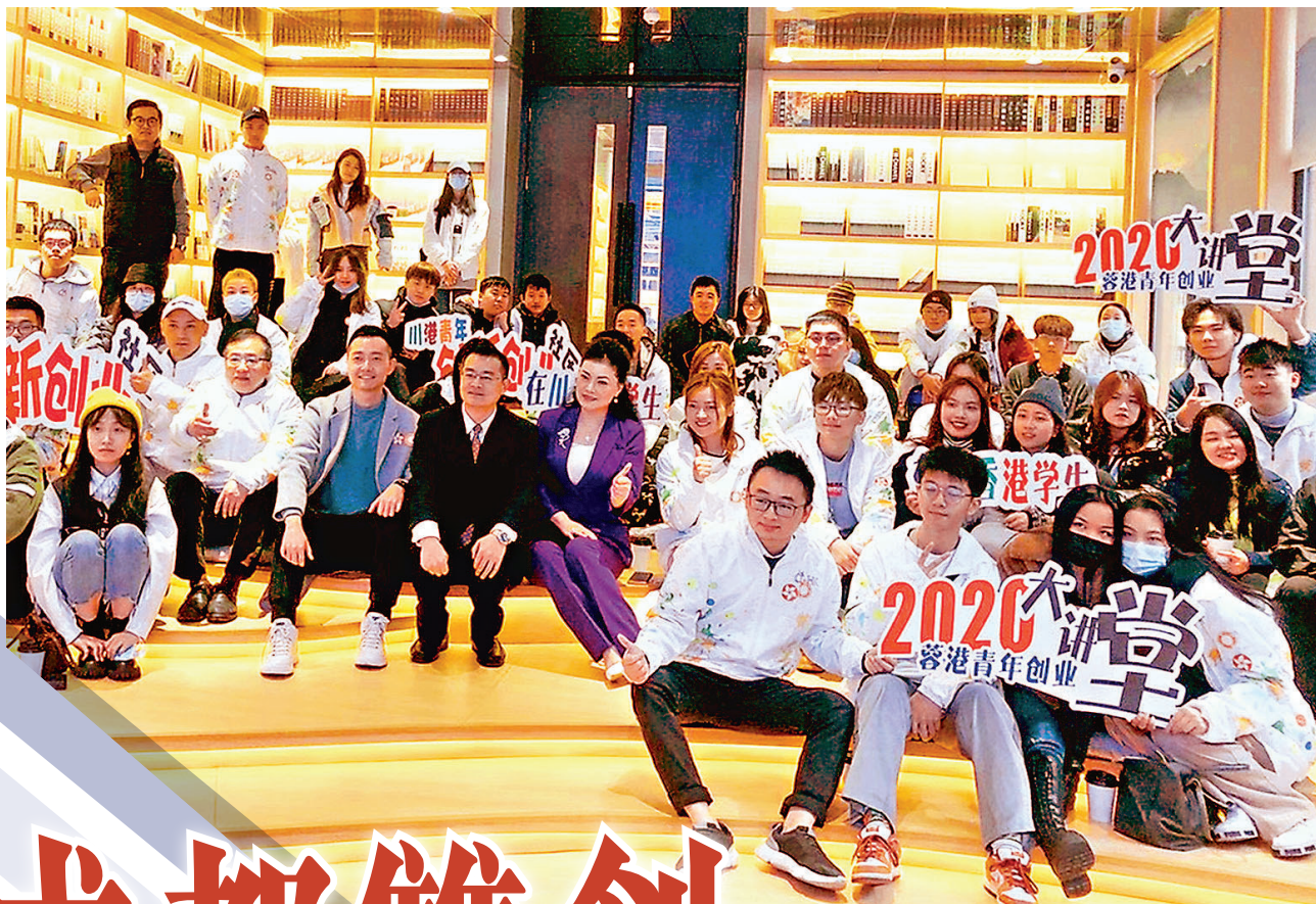
●蓉港青年交流創新創業經驗。