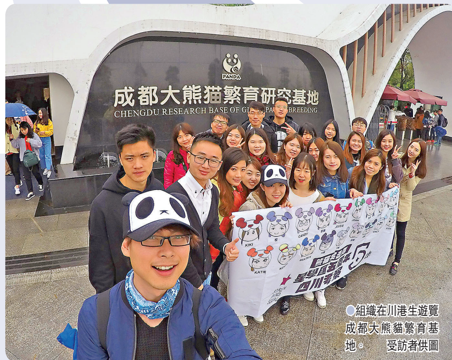
●組織在川港生遊覽成都大熊貓繁育研究基地。