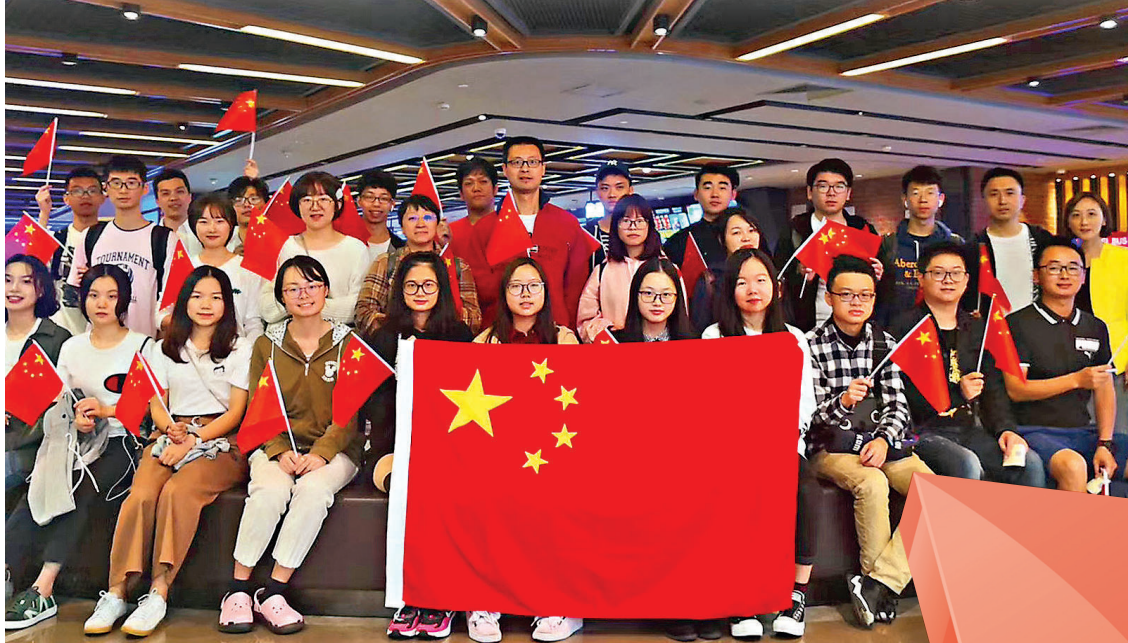
●組織在川港生觀看愛國主義電影《我和我的祖國》。