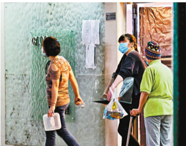
●5月4日晚，荃威花園R座全體居民需撤離戶接受強制檢測。