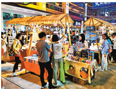
●5月2日晚，福建福州，民眾在夜間集市街區遊覽。