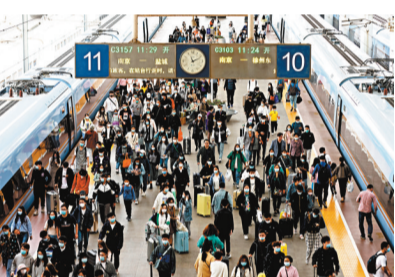
●5月5日，江蘇省南京市，旅客在南京火車站出行。中新社

今年「五一小長假」激發了疫情之後最火的旅遊消費季。5月2日晚，江西南昌，民眾在勝利路步行街休閒購物。中新社