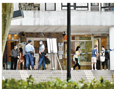
●5月5日，香港鯉魚涌康怡花園N2座住戶接受強制檢測。

有專家4日在檢視香港外輸入流程後認為，不排除香港的採樣質素出問題。特區政府的當務之急是要聯絡與「漏網」患者同期入住檢疫酒店的住客再做檢測，即使檢測呈陰性反應，也要抽血檢驗以了解是否帶有病毒。有份參與病毒基因排序的理大醫療科技及資訊學系副教授譚傑恆表示，走漏了一宗輸入個案，也足以引起新一波疫情。他建議政府設定入境人數限制，以免加重香港的防疫壓力。