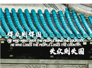
●節目以習近平總書記所引用的古代典籍和經典名句為切口，彰顯領導人「治大國如烹小鮮」的政治智慧。

香港文匯報訊 據央視新聞報道，由中央廣播電視總台CGTN（中國國際電視台）策劃製作的特別節目《經典裏的中國智慧——平「語」近人（國際版）》（第一季）5月6日起在CGTN新媒體多平台同步上線，並將在總台44種語言融媒體平台陸續發布。