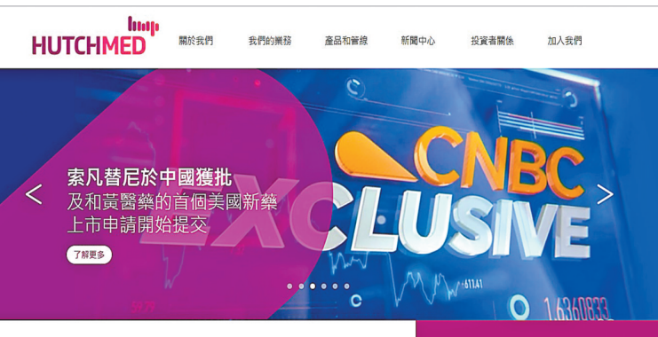
和黄醫藥已完成向FDA提交索凡替尼用於治療胰腺和非胰腺神經內分泌瘤(NET)的新藥上市申請。

【香港商報訊】記者吳天淇報導：長和(001)旗下和黄醫藥(中國)昨天宣布，已完成向美國食品藥品監督管理局(簡稱FDA)滾動提交索凡替尼用於治療胰腺和