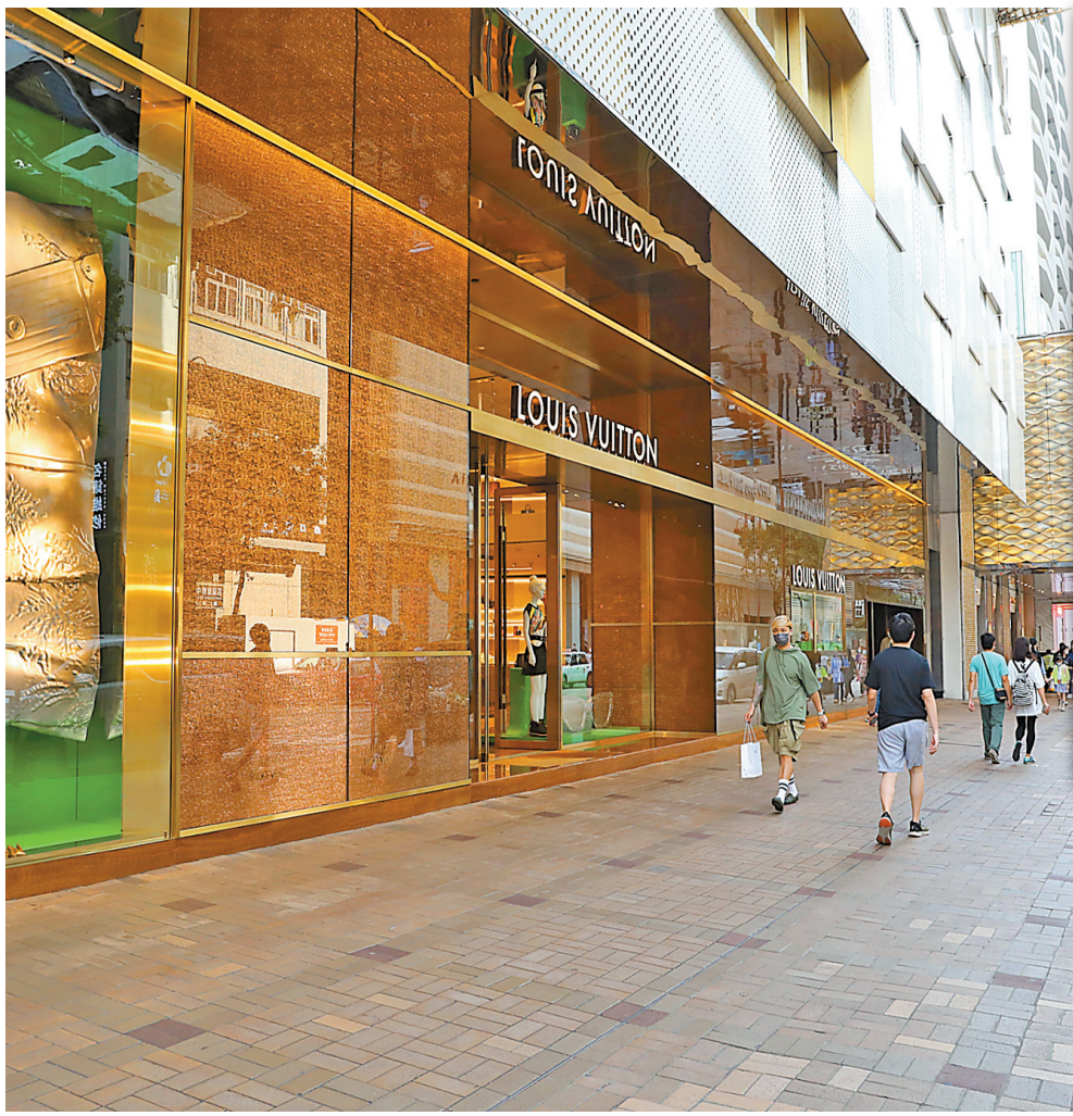
今年3月香港零售業銷貨額按年錄得顯著升幅，主要受惠去年低基數效應。