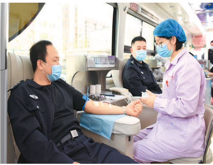
近日,辽宁省丹东港出入境边防检查站组织党员民警开展学党史·报党恩义务献血活动,以实际行动践行党史学习教育成效。

平台实时直播全省高速公路的重点易拥堵路段,包括成渝、成雅等10条高速公路20处视频监控点位,车主可以通过手机及时了解全省的路况情况。浙江交通部门推出了“浙里畅行”,实时查看“高速公路”,尤其可查看部分重点路段的实时监控视频,进行路径规划。此外,还能查看宁波、舟山、丽水的城市公交;杭州、宁波的城市地铁;宁波的水上巴士和公共单车;舟山综合换乘、舟山交通动态、丽水停车场分布情况等出行信息。