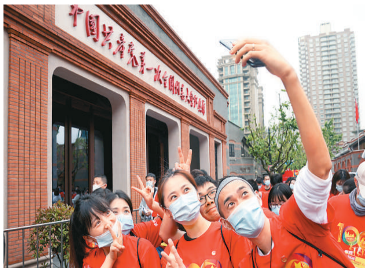
5月4日,在上海中共一大纪念馆国旗广场,参加“五四”主题集会的青年们在自拍合影。