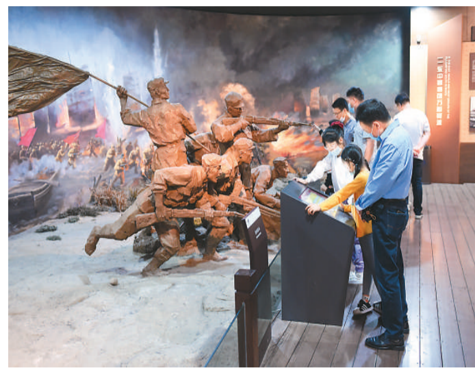
5月3日,游客在安徽合肥的渡江战役纪念馆参观。新华社记者 周牧摄