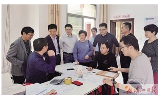
圖為莆田海關關員在莆田港區向企業人員發放國門生物安全、口岸反恐宣傳冊。

記者日前獲悉，莆田海關以“築牢口岸檢疫防線、守護國門生物安全”為主題，開展“海關國門生物安全日”宣傳教育活動，進校園、進網絡、進口岸、進社區、進企業等，多層次、多形式、多渠道進行國家安全宣傳教育。