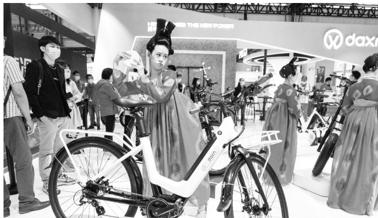
第30届中国国际自行车展览会开幕

在重点公共文化设施建设方面，中央单位重大文化广电和文物保护项目分类有序扎实推进，经济社会综合效益充分发挥，重点地区广播电视基础设施条件和广电智慧化水平显著提高，公共文化服务设施条件不断改善。