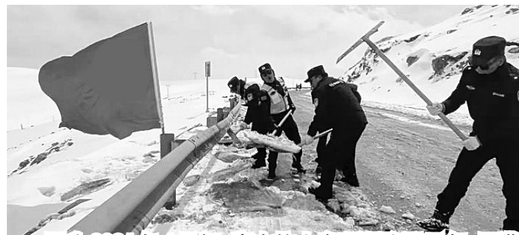
图为2021年4月初，唐古拉山出现强降雪天气，西藏安多县当地交警等进行除雪保通。

布林肯表示，过去15年期间发生了“一场世界范围的民主衰退”，但他承认美国本身在民主体制方面遇到“世界可以看到的”挑战。