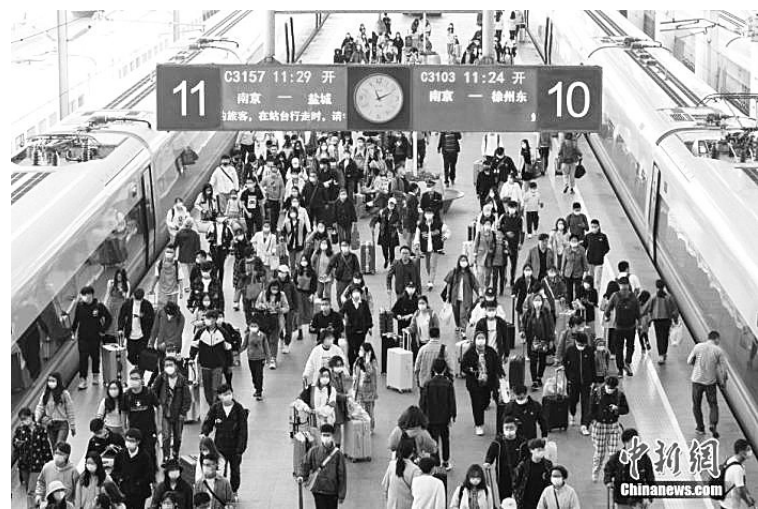
5月5日，江苏省南京市，旅客在南京火车站出行。中国国家铁路集团有限公司披露，当日全国铁路迎来“五一”假期返程客流高峰，预计发送旅客1720万人次，较2019年同期增长30%，预计加开旅客列车1736列。中新社记者 泱波 摄

青藏铁路集团公司加开西宁至格尔木、茶卡、德令哈、门源，格尔木至花土沟，拉萨至日喀则等方向