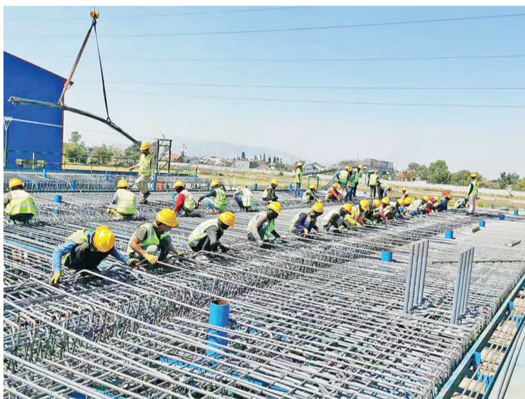
4号梁场预制箱梁施工人员在绑扎钢筋