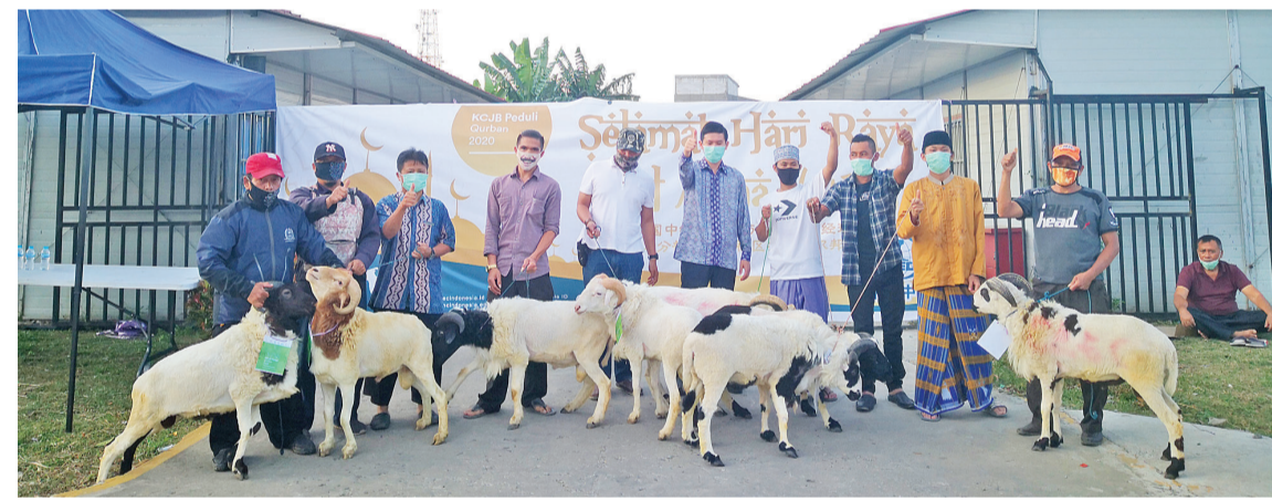
古尔邦节给周边村民捐赠山羊

【本报讯】五一国际劳动节恰逢印度尼西亚穆斯林开斋节前夕，双节中的中国中铁印尼雅万高铁4号制梁场(中铁四局一公司承建)场区灯火通明如同星光璀璨，施工现场紧张有序，钢筋绑扎胎座上错落有序的钢筋好比谱写的乐章，身穿CREC安全背心的中印尼工友们有序的忙碌着，一个个忙碌的身影就像一个个跳动音符，身着背心在灯光的映衬下闪闪发光，耀眼的灯光与月光相映，提梁机、运梁车等大型机械轰鸣声中伴随着的安全警报与夜虫竞相齐鸣……整个梁场宛如一个巨大的舞台，奋斗在制、架梁一线的上百名中印尼劳动者正在激情演绎