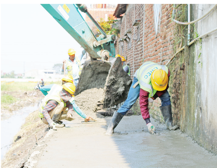
给周边村庄翻新道路