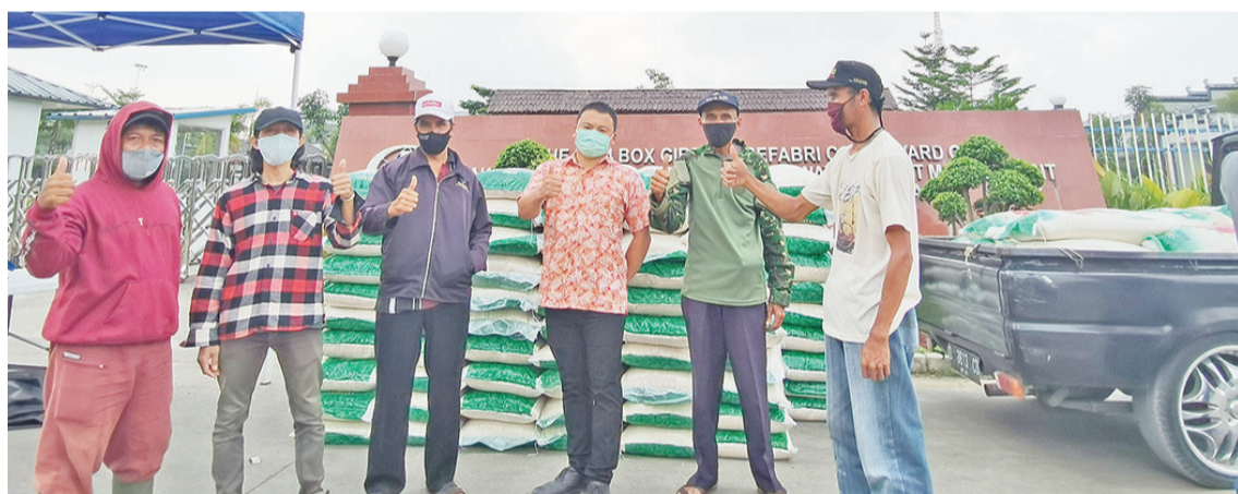
4号制梁场斋月期间给周边村民赠送大米