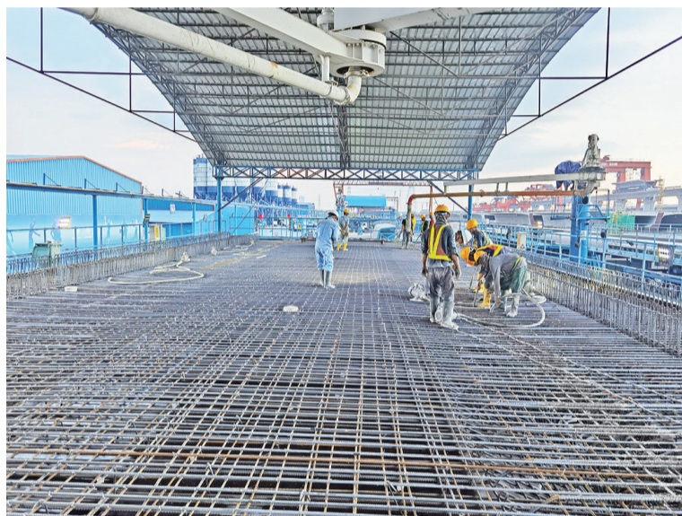
1号梁场箱梁浇筑施工

雅万高铁是“一带一路”倡议和中印尼两国务实合作的标志性项目，连接印尼首都雅加达和第四大城市万隆，全长142公里，最高设计时速350公里，是我国高铁首次全系统、全要素、全产业链在海外落地的典范工程。项目建成后，雅加达到万隆的出行时间将由现在的3个多小时缩短至40分钟，对助力印尼经济社会发展、深化中印尼两国经贸合作和人文交流、促进“一带一路”建设具有十分重要的意义。