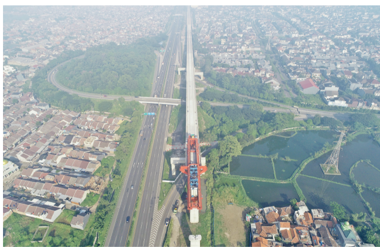
4号制梁场顺利完成连续跨路箱梁架设

一曲高亢的劳动赞歌，演奏着施工大干最强音，致敬奋战一线的雅万高铁建设者。斋月过后印尼将迎来盛大的开斋节，各级政府强化疫情防控政策，实行高速公路等交通管制并限制跨高速公路施工，4号制梁场积极与公共工程部、印尼安全委员会、高速公路管理局、地方交通管理部门、CDJO 监理等单位积极协调获得开斋节交通管制前夕和五一假日期间跨路架梁特别许可，4月30日—5月2日连续三天上跨高速公路施工架设箱梁9榀，顺利跨越高速公路 Mohammad toha 互通区，成功避开印尼开斋节前高速公路交通管制。4号制梁场在确保疫情防控到位的同