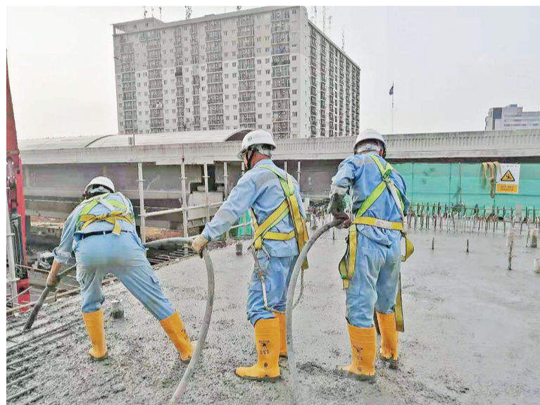
DK41连续梁浇筑施工