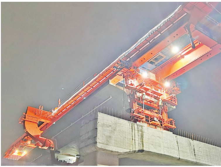
4号梁场“五一”期间开展夜间跨高速公路架梁施工

程和小里程两个方向，两架同时施工，搬、提、运、架”循环往复，每天箱梁预制最高达到4榀，完成箱梁架设4榀。在各连续梁工点，连续梁悬臂节段施工迈入“加速度”，立模、扎筋、预应力管道安装、混凝土浇筑等各道工序紧张有序进行，最快达到9天每对节段。