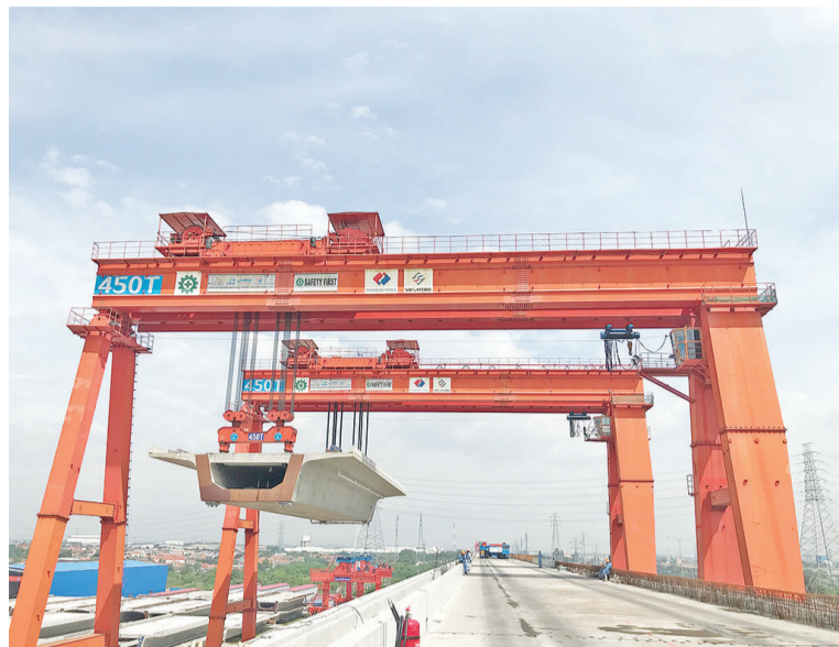
1号梁场提梁机提梁上桥