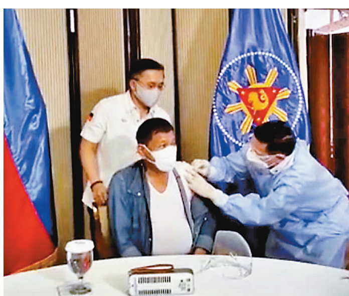
當地時間5月3日晚，菲律賓總統杜特爾特接種中國國藥新冠疫苗。