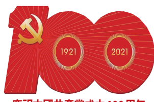
慶祝中國共產黨成立100周年