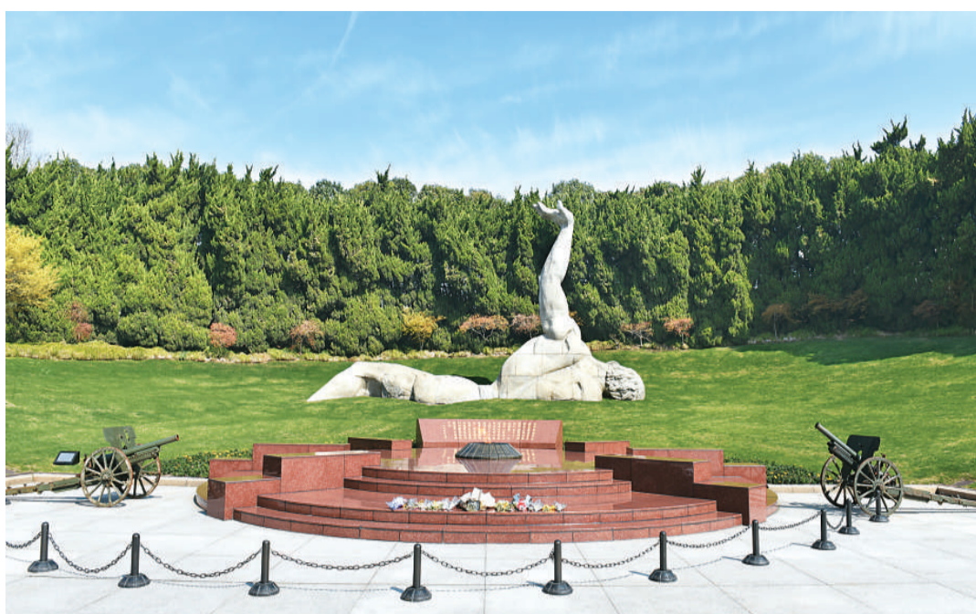
龙华烈士陵园无名烈士墓

90年过去了，中华大地上青春的身影往来如织。而在这里，追寻另一种殷红壮丽的青春。