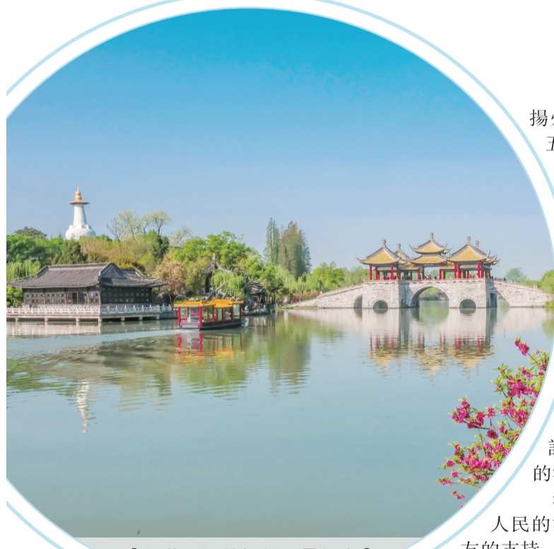
【烟花三月的揚州風景如畫】

烟花三月，揚州在最美的季節發出承諾：致力打造“好地方、事好辦”的營商環境，不斷增強城市對各路客商、創業精英、商界翹楚的凝聚力 and 向心力，讓更多的老朋友、好朋友、新朋友匯聚揚州、融入揚州、發展揚州，共建“好地方”，共繪新藍圖。