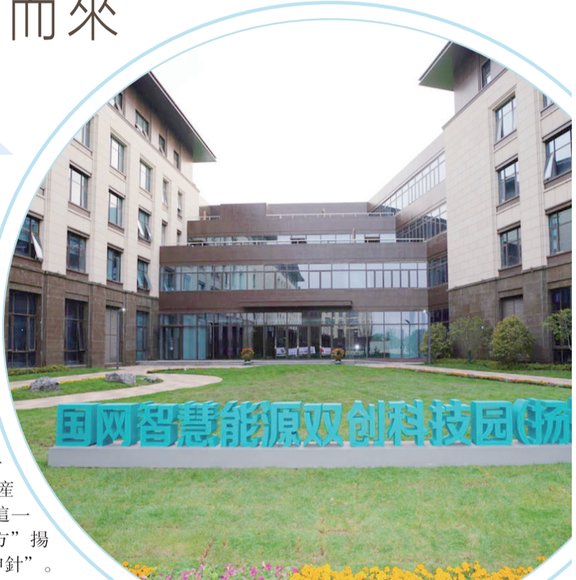
【國網智慧能源雙創科技園】

鍵在產業。近年來，聚焦產業尤其是製造業發展，揚州持續不斷播響產業強市的戰鼓，推動主導產業快速壯大、傳統產業迭代升級、新興產業提速發展，培育、壯大“323+1”先進製造業產業集群。此次簽約的項目，將進一步夯實產業基礎，完善產業鏈條。客商們說，這一個個項目就是“好地方”揚州未來發展的“定海神針”。