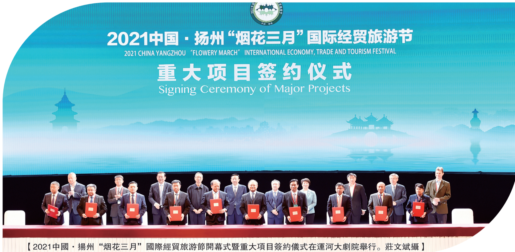
【2021中國·揚州“烟花三月”國際經貿旅遊節開幕式暨重大項目簽約儀式在運河大劇院舉行。】