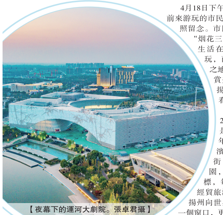
【夜幕下的運河大劇院。張卓君攝】

館等實現景觀協調、空間融合、功能共享。”該負責人說，運河大劇院將為藝術家打造表演和交流平臺，為公眾提供一流的藝術欣賞和文化休閒體驗。