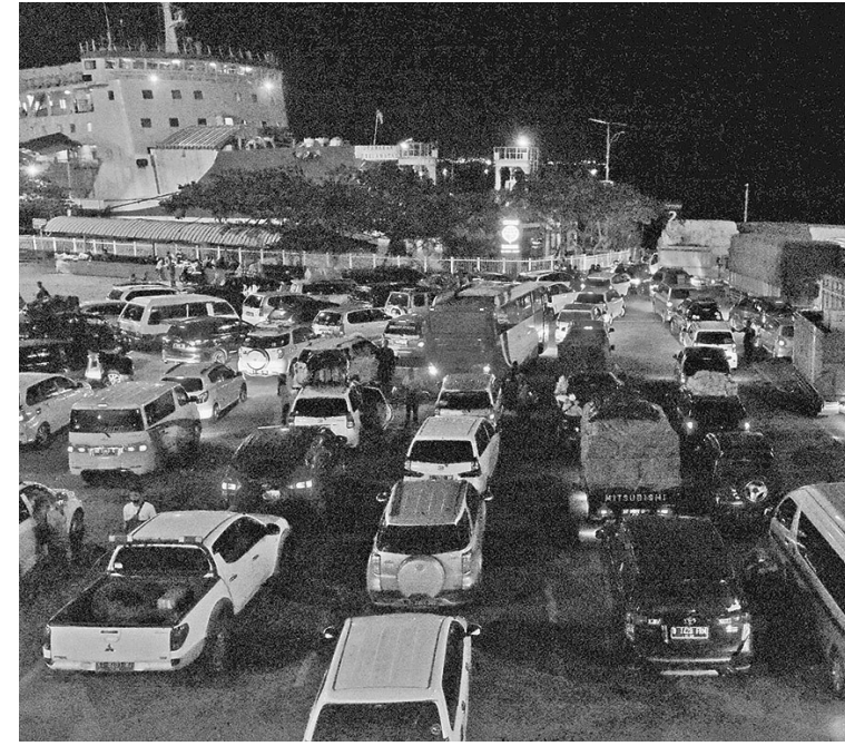
返乡客麇集孔雀港 根据孔雀港指挥站的报告,从今年4月28日至5月3日为止,通过孔雀港的返乡人数猛增或达18万44人,其中9819人是步行者,17万225人是车辆乘客。

根据孔雀港指挥站的报告,从今年4月28日至5月3日为止,通过孔雀港的返乡人数猛增或达18万44人,其中9819人是步行者,17万225人是车辆乘客。