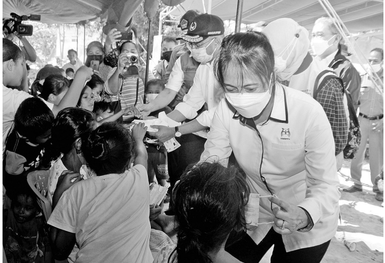
两部长探望东努省古邦县灾民 5月3日,妇女事务与儿童权益保护部长阿优明棠(I Gusti Ayu Bintang/右)同人力资源建设与文化统筹部长穆哈吉尔(Muhadjir Effendy/右二)到东努省古邦县探望洪灾灾民,并向受害者继承人提供1500万盾至3000万盾抚恤金。