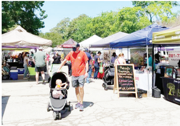
当地时间4月24日,美国休斯敦市“纪念村”社区(memorial village)的“周六农贸集市”吸引不少顾客。受新冠疫情影响,顾客须戴口罩购物。