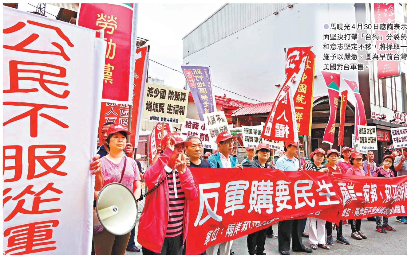
●馬曉光4月30日應詢表示，大陸方面堅決打擊「台獨」分裂勢力的決心和意志堅定不移，將採取一切必要措施予以嚴懲。圖為早前台灣民眾抗議美國對台軍售。