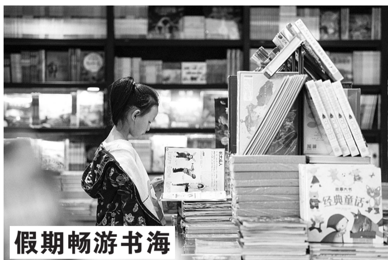
假期畅游书海 5月2日,小朋友在宁夏银川市西西弗书店挑选书籍。当日是“五一”假期的第二天。在宁夏银川市,不少市民选择走进书店、图书馆,选购、阅读书籍,在假期里畅游书的海洋。