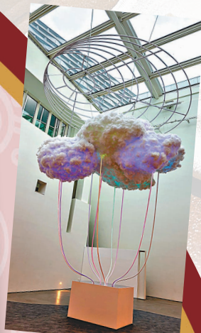
●林欣傑《雲圖境像 (2013—2021)》