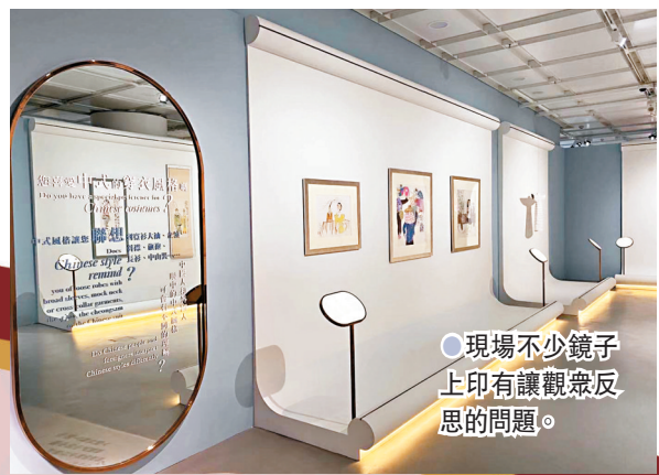
●現場不少鏡子上印有讓觀眾反思的問題。