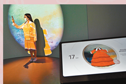
●參觀者可透過互動屏幕「選購」合適自己的獨特服飾。

討遊樂場為何是人生訓練場。這系列中有數件作品，其中以《上上落落，兜兜轉轉》最為吸睛，黃色的路軌又長又窄，還有高低起伏，就像過山車路軌般，在路軌的頂點站着一個穿着西裝的人，他手持平衡杆，好像正小心翼翼地往前走，「我發現遊樂場上好多設施都好像人生的歷程，人們常說人生就好像過山車般，上上落落，這作品也寓意着人生有高潮有低谷，我希望觀眾在欣賞作品時可思考現在自己的人生處於過山車的哪個位置。」馮力仁說。