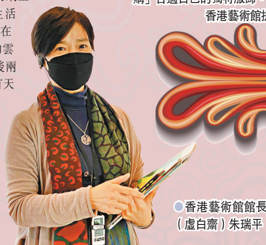
●香港藝術館館長（盧白齋）朱瑞平