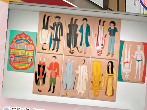
●石家豪《周潤發試身室》