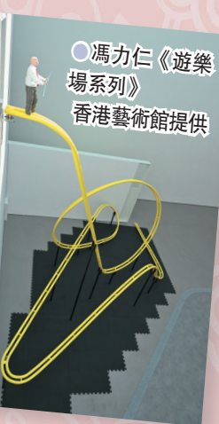
●馮力仁《遊樂場系列》