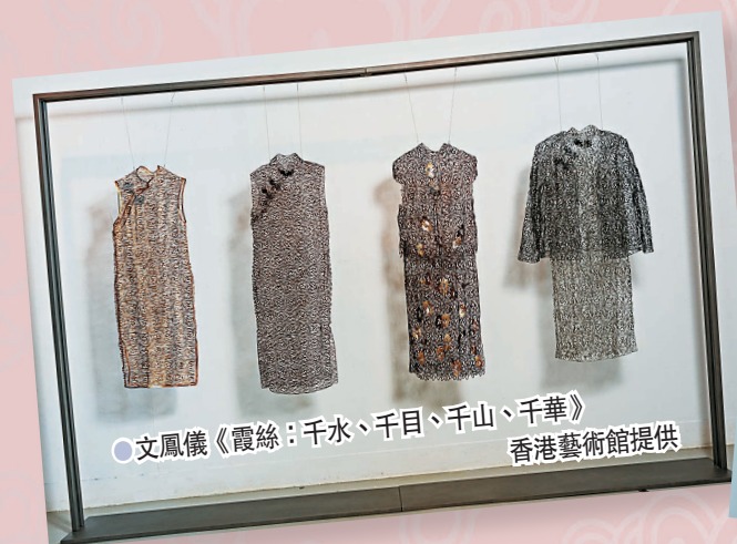
●文鳳儀《霞絲：千水、千目、千山、千華》