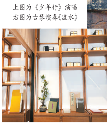
颐和园书院，霁清轩