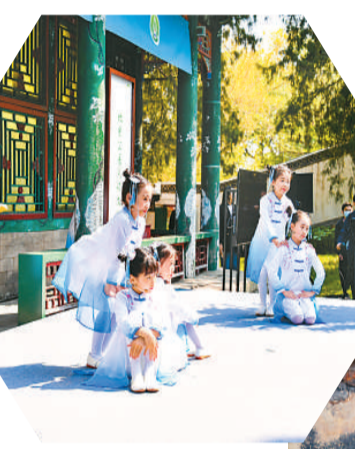
上图为《少年行》演唱 右图为古琴演奏《流水》

重要》。另有49种图书被推荐。国家图书馆副馆长汪东波介绍说，每年举办一次的文津图书奖评选，是以服务全民阅读为特征的国图重要品牌，它以开放、包容、共享的理念，开创了图书馆倡导读书、组织读书、服务读书的新形式。今年有97家图书馆参与文津奖推荐和初评工作，206家出版社参与推荐，图书馆、出版社、读者、评委等各方面推荐图书共计1991种。文津奖放眼全国，又侧重于能够传播知识、陶冶情操，提高公众思想道德素质与科学人文素养的普及性图书，主要分为社科、科普、少儿三类。