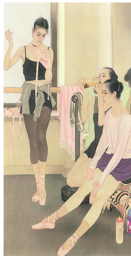
▲ 舟之憩（中国画）何家英

表示，参展的年轻画家非常有开拓性，在艺术语言、艺术风格、艺术表现形式上有很多突破。“过去的工笔画喜欢画仕女、动植物，在这个展览中，我们能看到各种劳动和生活的场面，包括在新时代涌现出的动人故事，说明工笔画紧跟时代步伐。”