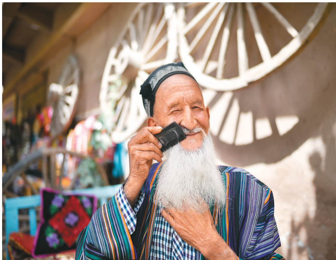
如今的新疆,各民族亲如一家,人民安居乐业。图为维吾尔族老人惬意地享受午后时光。