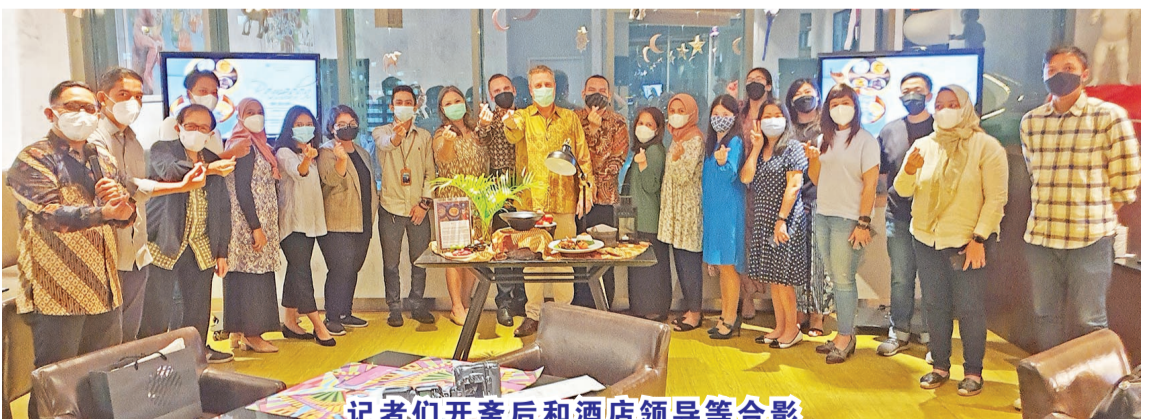
记者们开斋后和酒店领导等合影

此外,在斋戒月期间,Accor 企业社会责任(CSR)通过“Peduli Tunas Bangsa”基金会的“A Trust For A Child”计划邀请客人,每次在 Accor 酒店购买食品和饮料进行捐赠。预计这将能够帮助贫困的印尼儿童接受教育并创造更美好的未来。ALL 生活方式忠诚度