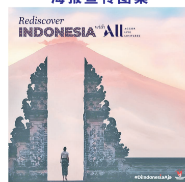
Rediscover Indonesia 宣传图案

计划,成为 ALL 成员很容易让您在预订此优惠时赚取积分并获得独家优惠。本报记者明光报道