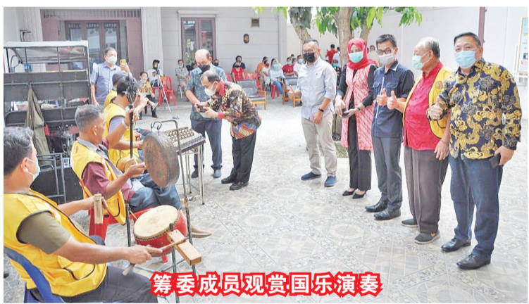
筹委成员观赏国乐演奏