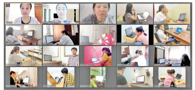
网上视频监控考场