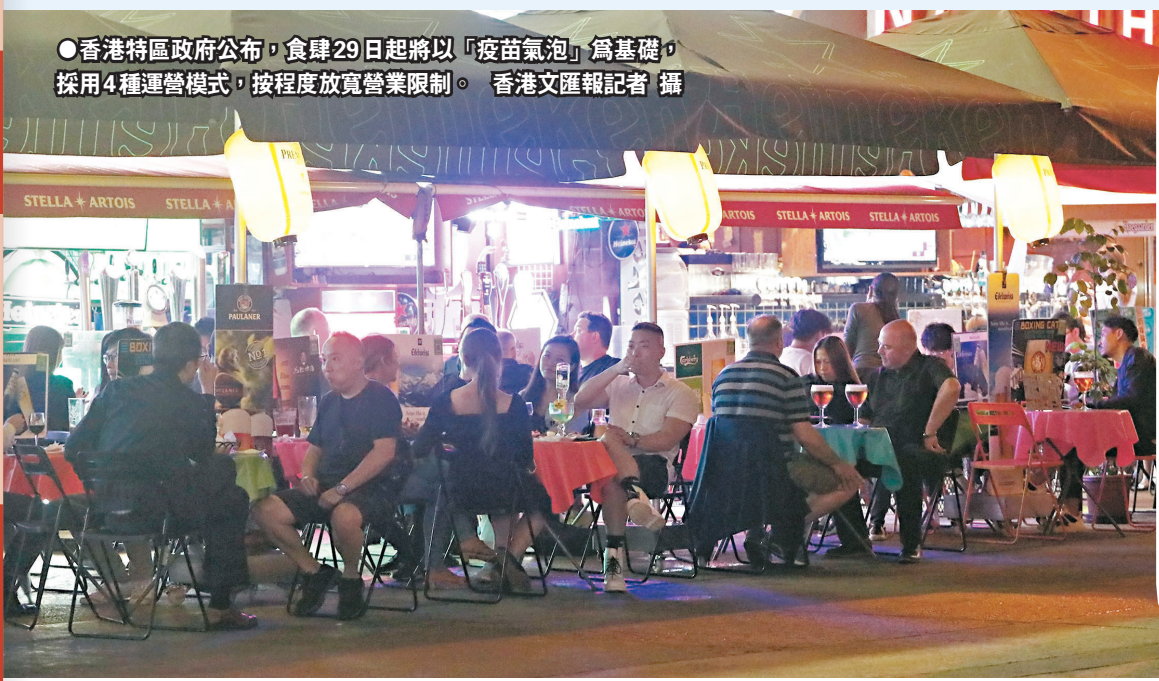
●香港特區政府公布，食肆29日起將以「疫苗氣泡」為基礎，採用4種營運模式，按程度放寬營業限制。