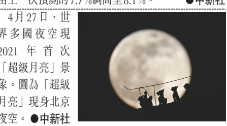
4月27日，世界多國夜空現2021年首次「超級月亮」景象。圖為「超級月亮」現身北京夜空。

亞洲開發銀行28日發布的《2021年亞洲發展展望》報告指出，在全球經濟穩健復甦和新冠疫苗研發取得早期進展的支撐下，亞太地區發展中經濟體的經濟增長今年將反彈至7.3%，而中國經濟增速更由上一次預測的7.7%調高至8.1%。