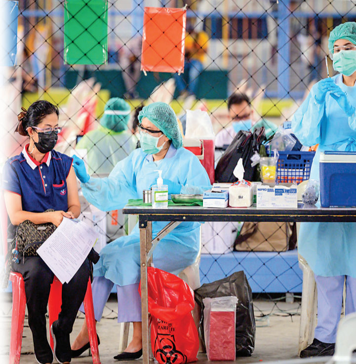
●泰國民眾日前接種國藥疫苗。

●中國向至少80個國家和3個國際組織援助疫苗，目前向巴基斯坦、柬埔寨、老撾、赤道幾內亞、津巴布韋、蒙古國、白俄羅斯等國援助的疫苗已經運抵。