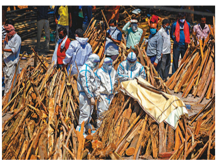
●印度新冠死者家屬穿着保護衣送別親人。