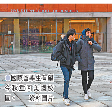
●國際留學生有望今秋重回美國校園。

據美國中文網報道，中國留學生是美國國際學生中的最大群體。2019至2020學年，有37.2萬中國公民在美國大學和學院就讀。2020年初，時任總統特朗普對來自中國大陸的大多數非美國公民實施了旅行禁令，這阻礙了許多學生的留學計劃。美國教育理事會(ACE)援引的一項研究稱，2019至2020學年，國際學生創造的經