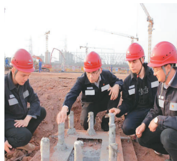
近日，位于粤港澳大湾区的广州增城区中通道工程现场，建设者启动多项施工工作。该工程是南方电网广东广州供电局独立承接的第一个直流水工程，完工后将作为粤港澳大湾区建设提供安全可靠、包容性好、适应性强的电网网架支撑。图为施工现场。

指挥中心统计，截至目前台湾地区累计203734例新冠肺炎相关通报（含201523例排除），其中1104例确诊，确诊个案中12人死亡。