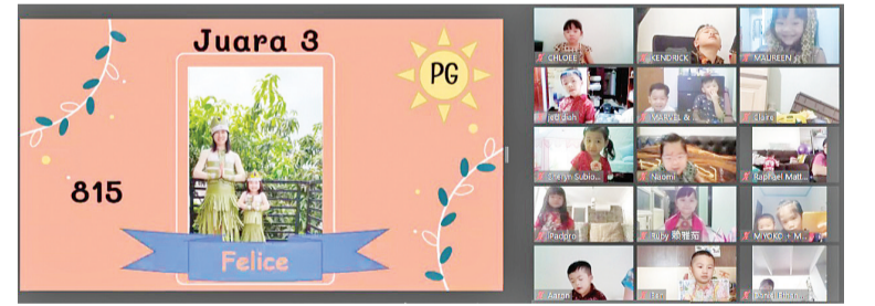
PG 班级 季军者