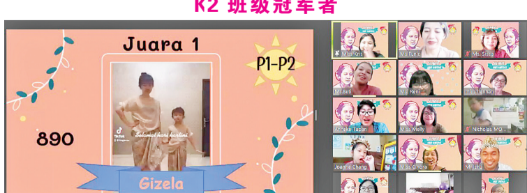
P1-P2 班级 冠军者