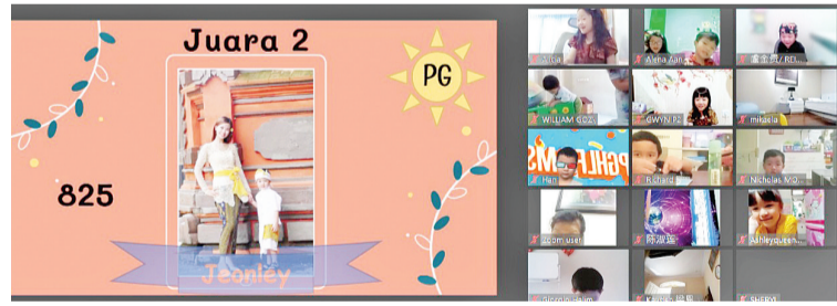
PG 班级 亚军者