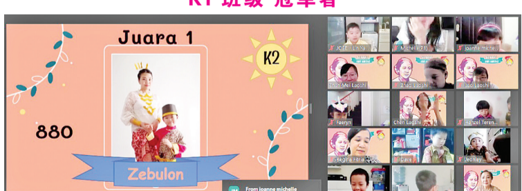
K2 班级 冠军者