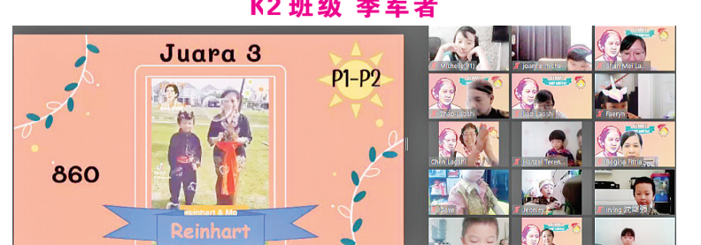
P1-P2 班级 季军者