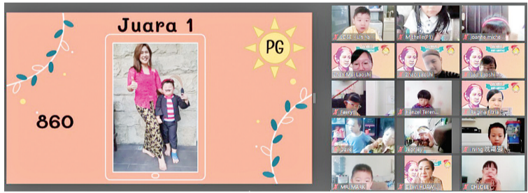
PG 班级 冠军者