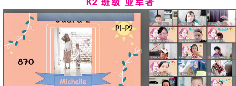
P1-P2 班级 亚军者