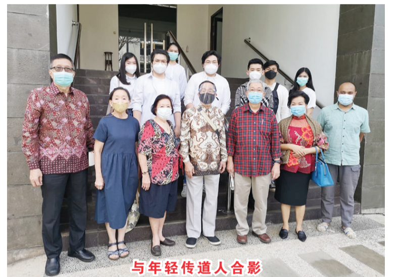
与年轻传道人合影