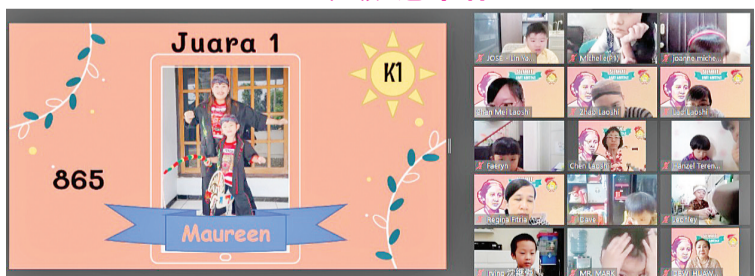
K1 班级 冠军者