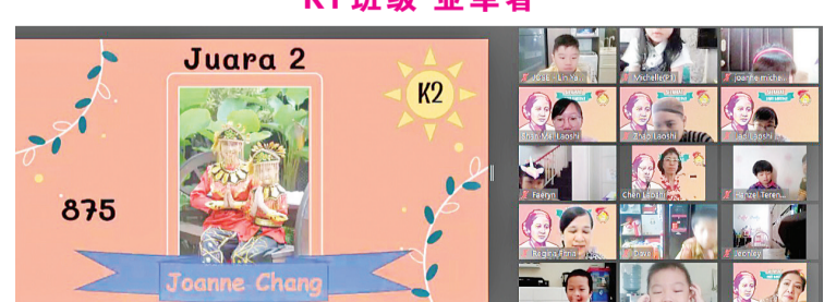
K2 班级 亚军者