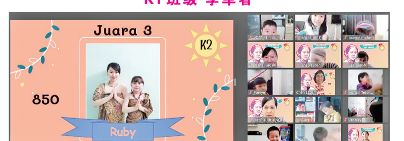
K2 班级 季军者