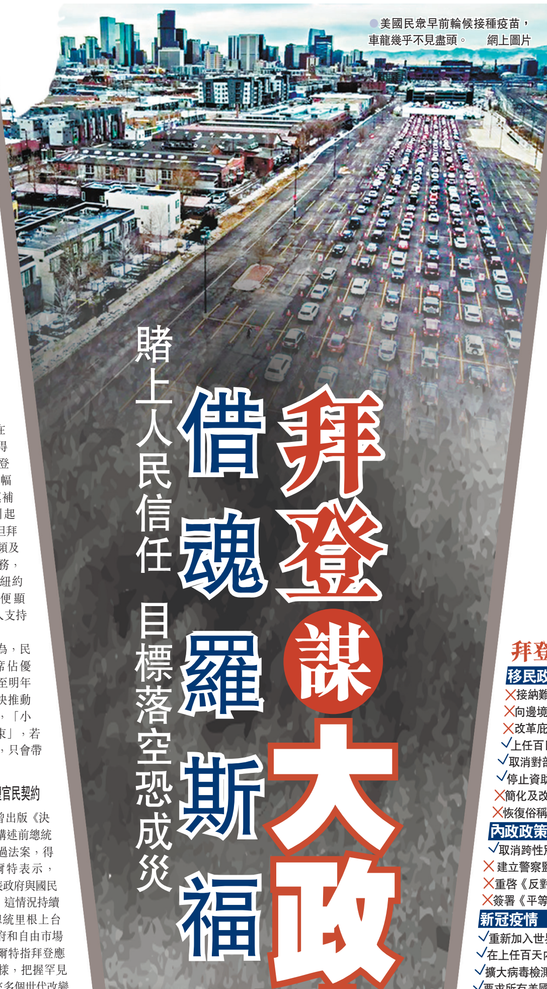
●美國民眾早前輪候接種疫苗，車龍幾乎不見盡頭。網上圖片