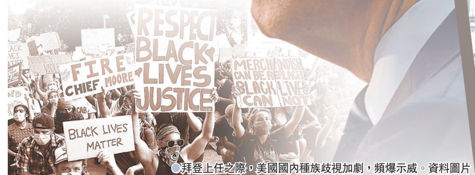
●拜登上任之際，美國國內種族歧視加劇，頻爆示威。