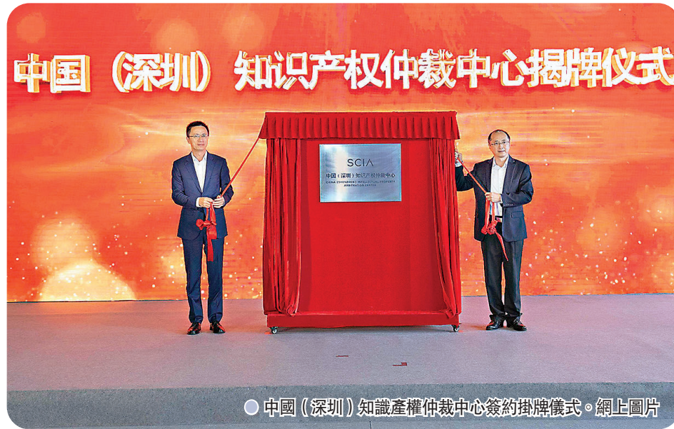
中國(深圳)知識產權仲裁中心簽約掛牌儀式。網上圖片