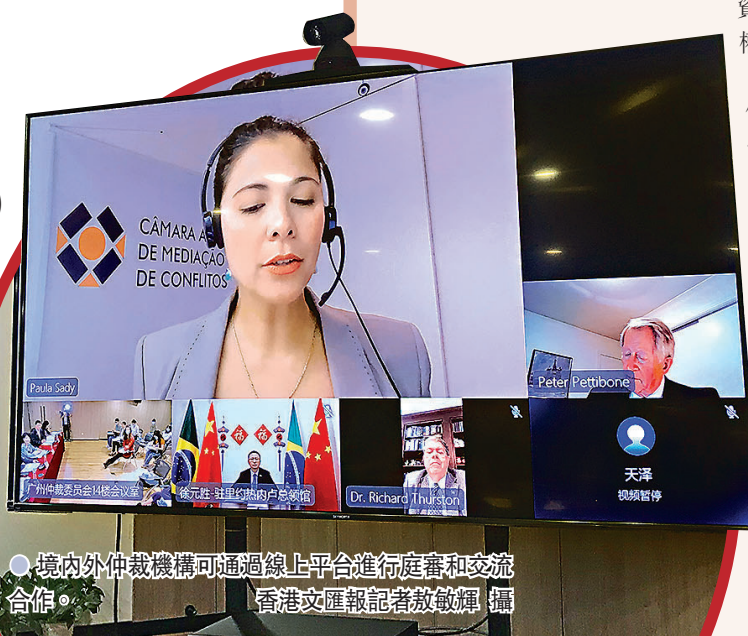
境內外仲裁機構可通過線上平台進行庭審和交流合作。

廣州仲裁委負責人表示，廣仲與境外仲裁機構的合作首先是與港澳及新加坡等華語地區，接下來，將重點通過香港、新加坡輻射英聯邦國家，經由澳門輻射葡語系國家。