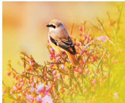
甘肃张掖国家湿地公园里，几只伯劳鸟穿梭在花丛中觅食。