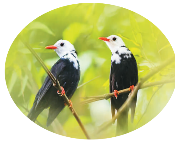
黑短脚鹑。

近几年来，保护区内新记录野生动植物26种，新记录野生植物61种；科研人员对区内内圆桶、半枫荷、美毛含笑、红豆树、花榈木等11种极小种群野生植物实施拯救性人工扩群工作。现保护区森林覆盖率达97.43%，生态环境优良。