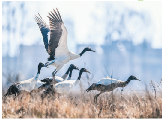
贵州草海保护区胡竹林核心区的黑颈鹤。

团结社会团体发动群众共同保护鸟类。近年，在“爱鸟周”期间内，各地积极组织推进观鸟活动，让更多人到野外欣赏鸟、观察鸟，来提高爱鸟护鸟的意识，通过这一系列的活动，带动了越来越多的人加入到爱鸟护鸟队伍中。