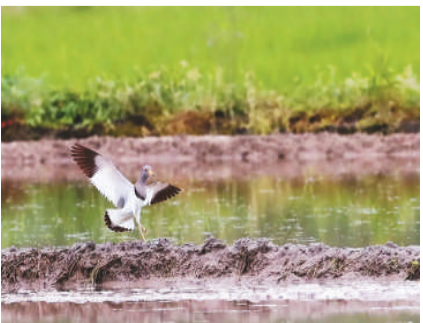
灰头麦鸡。