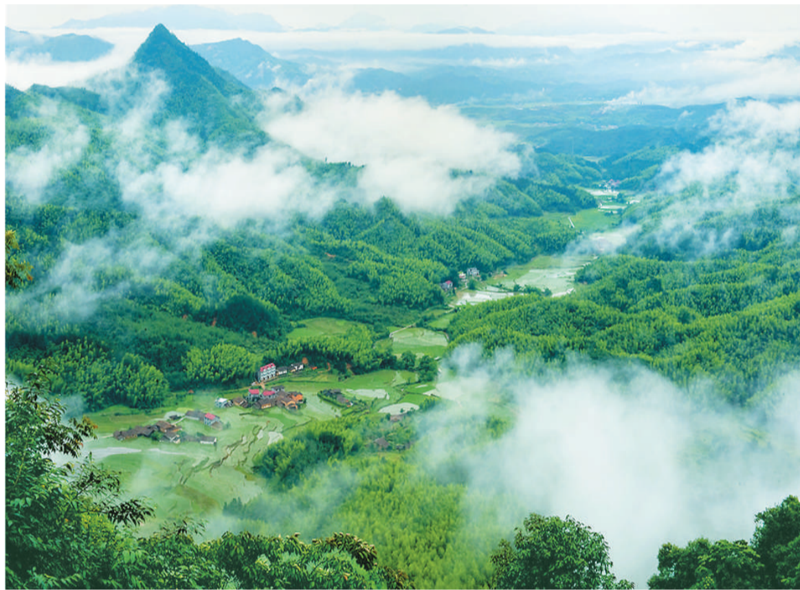
江西省抚州市资溪县风光。