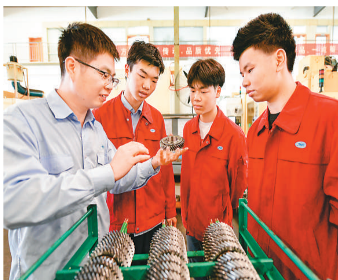
近年来，江西省赣州市章贡区积极发展职业教育，聚焦重点产业设置专业，将课堂设在企业车间，缓解学生就业难。图为赣州市第一职业学校校外实训基地实训车间，企业指导教师为学生授课。

近期加大职业技能培训和开发有关。“增”的是旅游、餐饮等消费类职业，如中式烹调师、客房服务员、前厅服务员、餐厅服务员等，“这也反映疫情防控的良好态势继续得到巩固，相关消费需求不断被激发。”吴礼彪说。