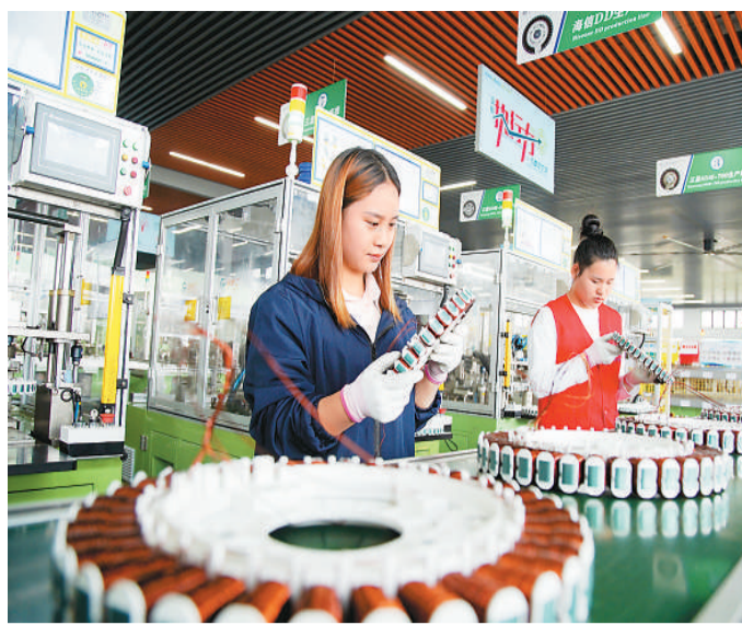
近年来，位于浙江省湖州市南浔经济开发区的南洋电机有限公司，持续增加研发投入，提升研发能力，产品远销东南亚、欧洲等海外市场，有效带动社会就业。图为工人在加紧生产一批销往海外的洗衣机变频电机。