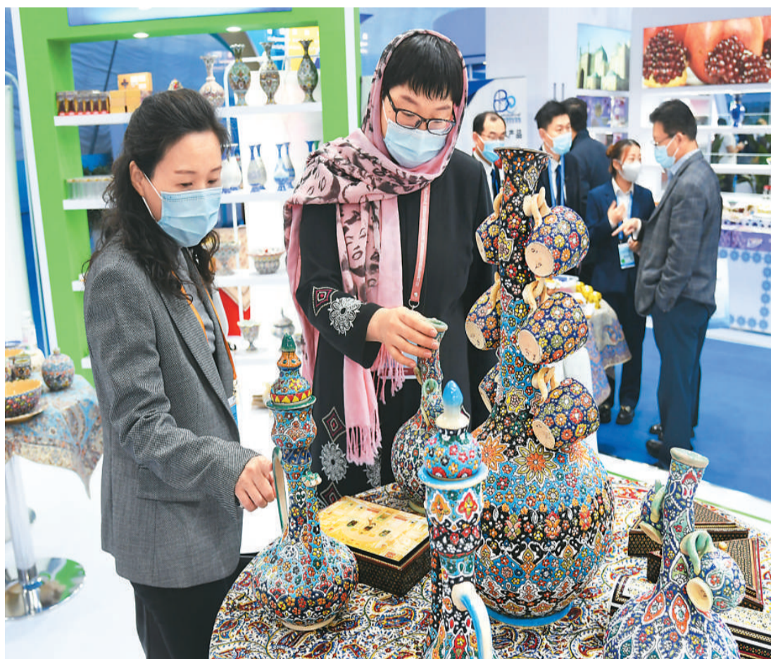
4月26日，为期3天的2021上海合作组织国际投资贸易博览会暨上海合作组织地方经贸合作青岛论坛在山东青岛开幕。博览会主要包括开幕式、青岛论坛、上海合作组织国家驻华使节推介暨企业投资贸易洽谈会等板块。图为与会嘉宾在各国形象展区参观。