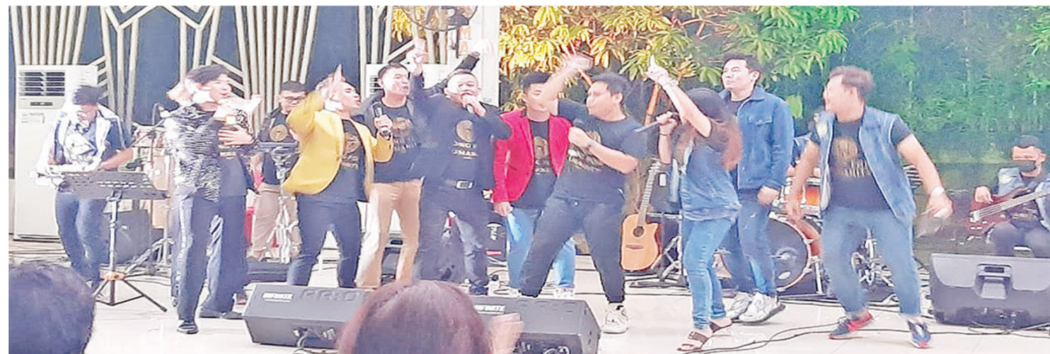
天才扶轮社社员们齐唱《Kita Bisa》