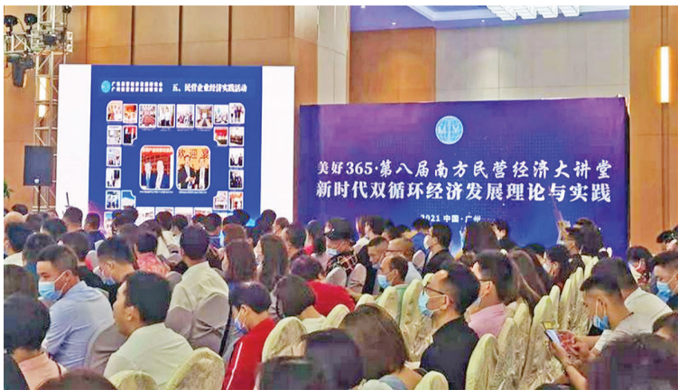
第八届南方民营经济大讲堂活动现场