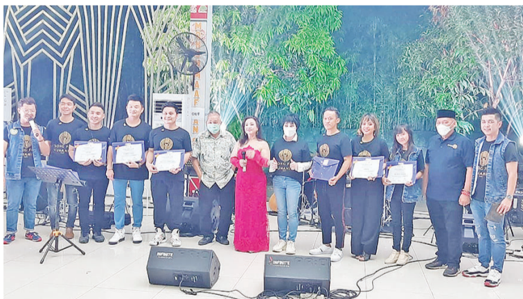
颁发感谢状后合照