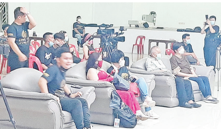
在线慈善募款现场