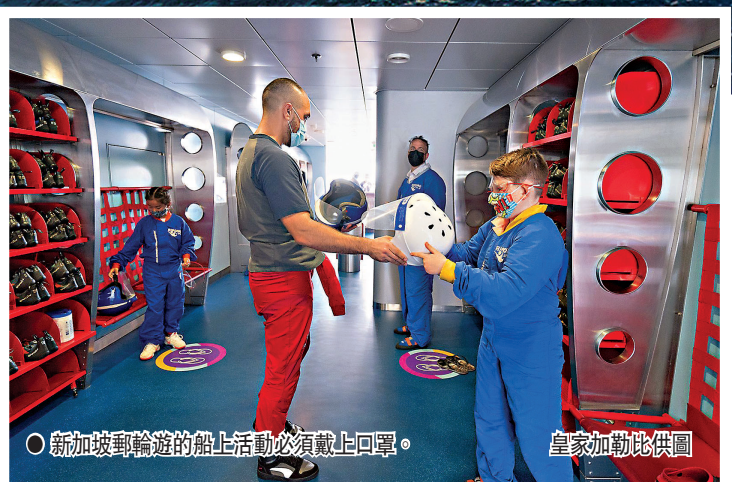
○新加坡郵輪遊的船上活動必須戴上口罩。