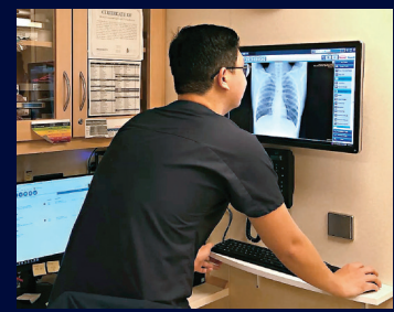
●新加坡公海遊的郵輪上有充足醫療人員和設施。

她說，事件發生時，他們能完全執行既定程序，郵輪上沒有人受感染，當日身體不適的旅客最後證實只屬「假陽性」。新加坡郵輪遊重啟4個多月，至今未有確診個案，足證在具備完善防疫措施下，旅客可享受既安全又舒適的郵輪旅程。她希望新加坡的成功經驗，可讓香港在重啟郵輪遊時作借鏡。