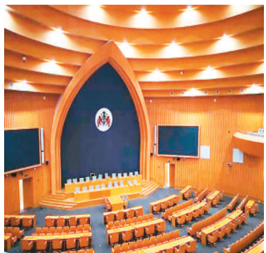
冈比亚国际会议中心主会议厅。

建筑面积达14800多平方米，1间1000座的主会议厅、4间200座的主题会议室、14间双边会议室、4间新闻发布厅……坐落在非洲“微笑海岸”的冈