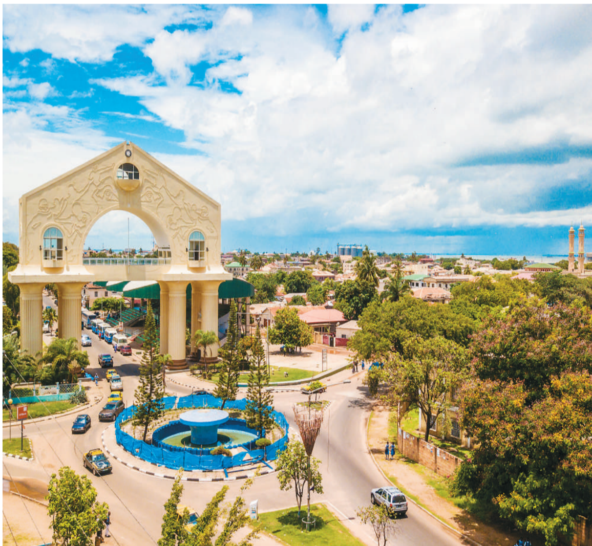
冈比亚首都班珠尔地标性建筑“拱门二二”。

中国用实实在在的实际行动表明，中国在减贫实践中探索形成的宝贵经验，既属于中国，也属于世界。