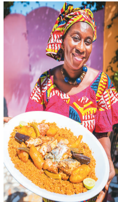
冈比亚妇女展示当地特色美食。

游客一定要到班珠尔集市上走一走。这里有非洲风情的雕刻、扎染、编织布艺，更有能说会道的小商贩热情地招揽生意。尽管这里的手工艺品物美价廉，但游客可以试试讨价还价的乐趣。在热情开朗的冈比亚人看来，讨价还价是游客了解冈比亚文化的不错方式。