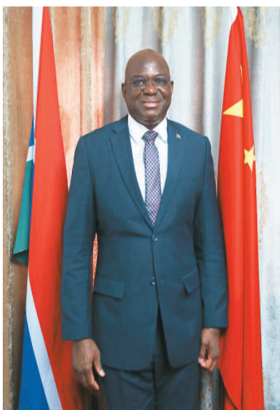
冈比亚驻华大使马萨内·纽库·康蒂近照。

“冈比亚各个领域有大量投资机会，我们欢迎中国企业。”康蒂举例说，冈比亚是个农业国家，绝大多数人口务农，但目前粮食还无法自给自足，包括大米在内的食品主要依赖进口。冈比亚有大片肥沃土地尚待开垦，政府正在加大农业投入，冈中农业合作取得积极成果，未来希望从中国引进更多先进农业技术。被誉为非洲“微笑海岸”的冈比亚旅游资源丰富，风光秀美、人民淳朴热情、文化包容和谐、社会安定有序，欢迎中国企业投资冈比亚旅游业、酒店业、航空业。