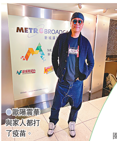
●歐陽震華與家人都打了疫苗。

合東方人的體質,西方那種就留給西方人吧!」他更透露於7至8月會再返內地橫店拍攝網大《洗冤錄2》,而他都放心去工作,因內地疫情一直清零,抗疫功夫做得甚好。而家燕姐亦笑謂Bobby本身是大忙人,他與家人都打了疫苗:「Bobby是個福將,福到上大陸!」被讚是福將又會否想參與無綫的綜藝節目與友台對撼? Bobby表示有良性競爭是好事,不要講到打仗般,也是各有各做。家燕姐也覺得最好百花齊放,可以去良性競爭。