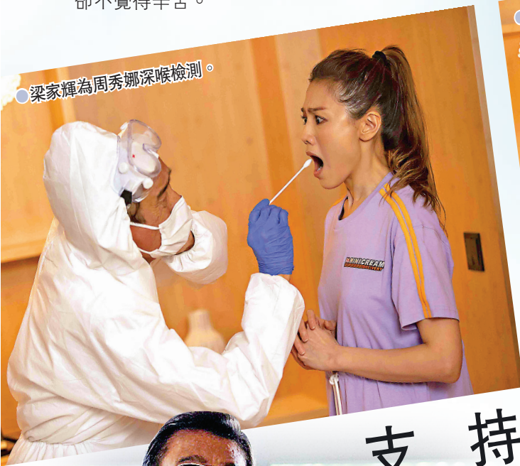
●梁家輝為周秀娜深喉檢測。

香港文匯報訊(記者 阿祖)香港十家電影公司合資開拍的抗疫電影《總是有愛在隔離》已經上畫,63歲影帝梁家輝表示,自己已半隻腳離開影圈,今次因為疫情而答應演出,在戲中被周秀娜連番掌摑,被摑得又紅又腫,要不停敷冰,但卻不覺得辛苦。