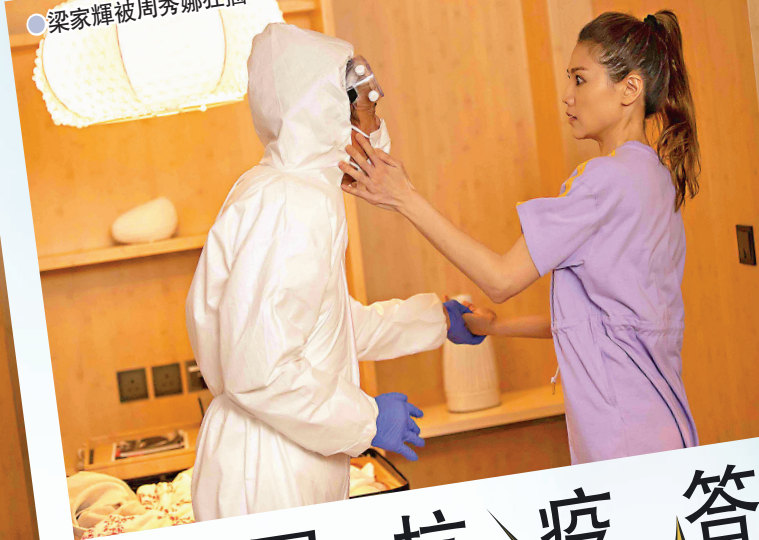
●梁家輝被周秀娜狂摑。