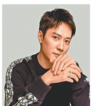
●馮紹峰呼籲廣大公眾共同維護健康文明的網絡文化環境。

據分析指,這次趙麗穎與馮紹峰結束婚姻關係,外間的輿論普遍是支持,並且傾向於趙麗穎一方,原因大概也是覺得馮紹峰配不上趙麗穎。可是論家庭背景,馮紹峰家境殷實,男方比女方要好得多,學歷上亦較女方高,不過,正因為趙麗穎無深厚背景,卻獨自闖蕩成為85後小花的代表,可以說是勵志女王的代表,但為了跟馮紹峰結婚生子而一度暫停演藝事業,讓很多人覺得不值得。