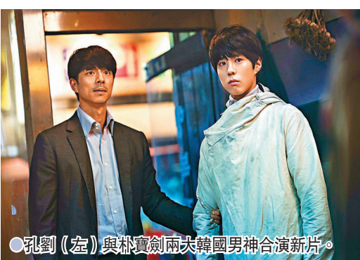
●孔劉(左)與朴寶劍兩次韓國男神合演新片。

孔劉說:「我會把不對的事情說出來,有人被冤枉就是被冤枉,不管是誰只要做不對的事情,那就是不對。」孔劉認為也許以自己的藝人身份來說,面對不公義事件需要謹慎,但也無法當作沒有這回事。