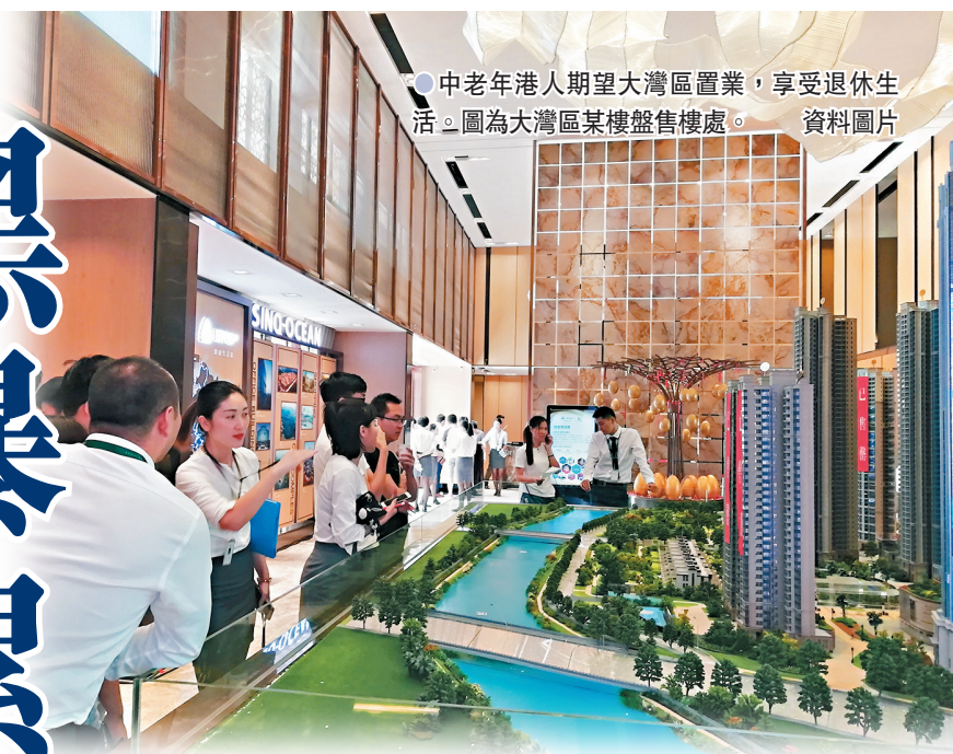
●中老年港人期望大灣區置業，享受退休生活。圖為大灣區某樓盤售樓處。資料圖片