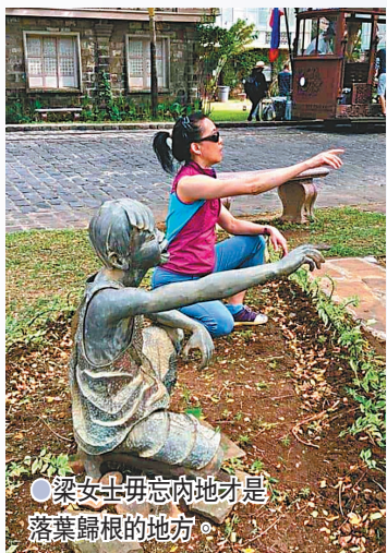
●梁女士毋忘內地才是落葉歸根的地方。

53歲的梁女士從事市場推廣文職工作，年輕時周遊列國，在全球各地尋覓覓還是覺得內地才是落葉歸根的地方，「近年留在『自己地方』的念頭愈來愈強，我是中國人，這是不爭的事實！」今年初，她到內地觀摩，乍見內地已高速發展為智能城市，對銀髮族配套贏港幾條街，回港後馬上置入廣東省中山市一套物業，並與同屬單身的胞妹協定，60歲之前回內地享受退休生活。