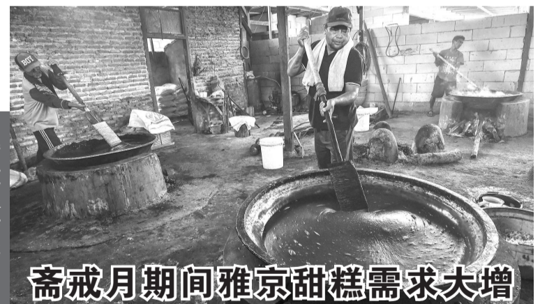
斋戒月期间雅京甜糕需求大增

根据记录,从今年1月至3月期间,非油气加工业的出口价值达到389.6亿美元,同比增长了18.06%,因此我国的贸易平衡表出现了大约36.9亿美元的顺差,这是制造业的出口业绩有所增长所带来的成就。(Sm)