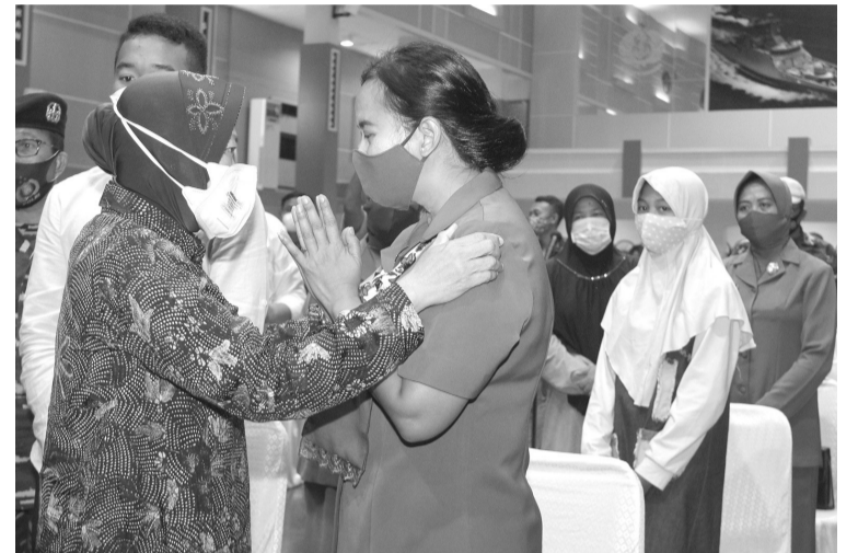
两部长探访遇难潜艇士兵家属

社会部长丽思玛 (Tri Rismaharani/左) 于4月25日在东爪省泗水市探访遇难的 Nanggala 402 号潜艇队员家属。她与人力资源建设与文化统筹部长穆哈吉尔 (Muhadjir) 的慰问为潜艇队员家属带来有力的道德支持。