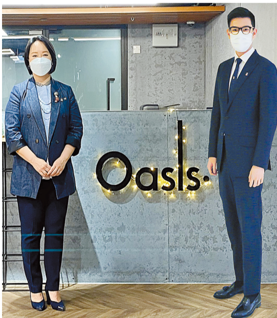
譚鎮國主席(右)表示東華三院非常重視青年培訓工作，期望薪火相傳，讓青年人成為未來的領導者，以愛國愛港之情攜手推動本港發展。

計劃其中一個重點為加強青年創業者的營商知識，不同主題的營商培訓工作坊會邀請多位資深律師、會計師及在不同領域創業的成功人士，提供法律、會計及營銷等專業範疇的諮詢服務，並已聯絡了與東華三院有業務往來的銀行協助青年創業者在大灣區和香港開設銀行戶口，讓他們在業務發展方面能有更多專業支援，以便業務順利發展。