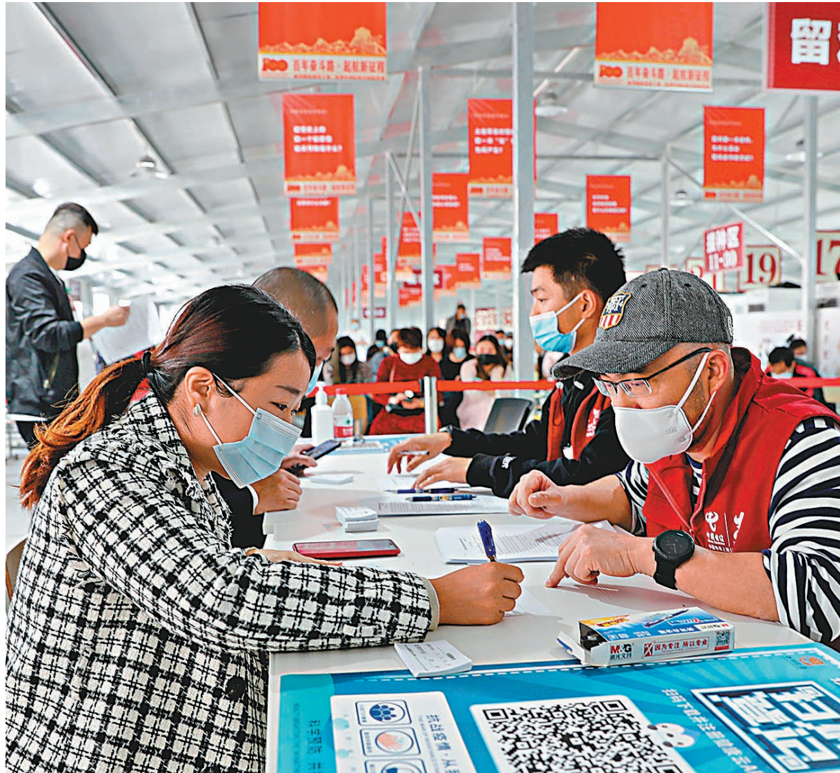
●中疾控報告認為，接種新冠疫苗使得病例的臨床症狀較輕、病程短暫、病毒載量較低幾乎沒有傳染性。圖為4月19日在上海居住的台胞「開打」新冠疫苗，進行預檢和登記。