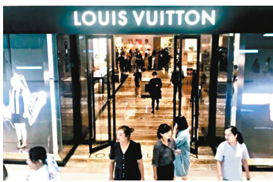
路易威登集團、普拉達和歷峰集團旗下的卡地亞20日表示，已合作開發一個全球區塊鏈平台，以助消費者更好地追蹤和驗證產品。