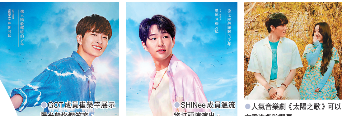
● GOT 成員崔榮宰展示陽光般燦爛笑容。