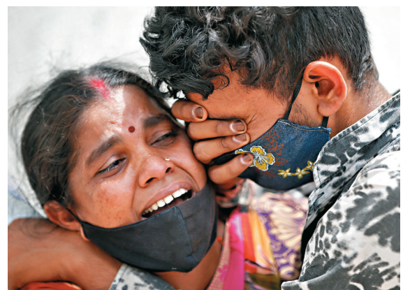
● 一名新冠男病人病逝，遺下妻兒。

印度的新冠疫情急速惡化，19日單日確診繼續維持於25.9萬宗的高位，多個邦的疫苗供應不足，以致接種進度緩慢。印度外長蘇傑生同日與美國國務卿布林肯通電話，據印方消息人士透露，蘇傑生敦促華府短期內解除對疫苗原材料的出口禁令，讓印度取得原材料，以加快生產疫苗。美國拜登政府表示會考慮解除禁令，並盡快採取行動。