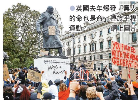
● 英國去年爆發「黑人的命也是命」種族平權運動。