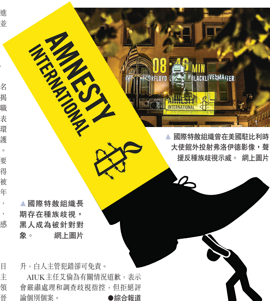
▲ 國際特赦組織曾在美國駐比利時大使館外投射弗洛伊德影像，聲援反種族歧視示威。