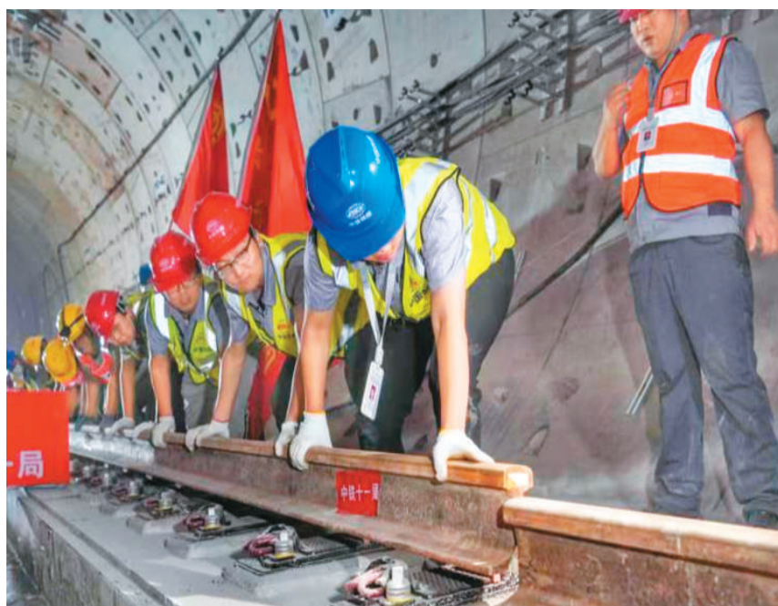
图为广州地铁18号线施工现场。