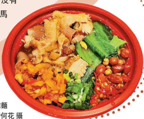
● 香港特色牛雜燉

今年35歲的岑明峰稱自己已經是「半個內地人」。「在內地讀大學，在內地娶老婆，還在內地開了公司，差不多兩年沒回香港了。」不過他同時又強調，「雖然在內地開公司，吃的還是「港味」的飯。」他認為自己更精確的身份應該是個「灣區人」。