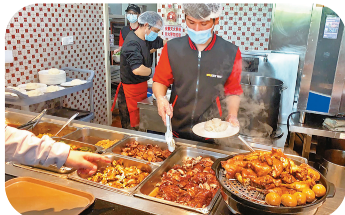
● 檔口的工作人員正在工作。