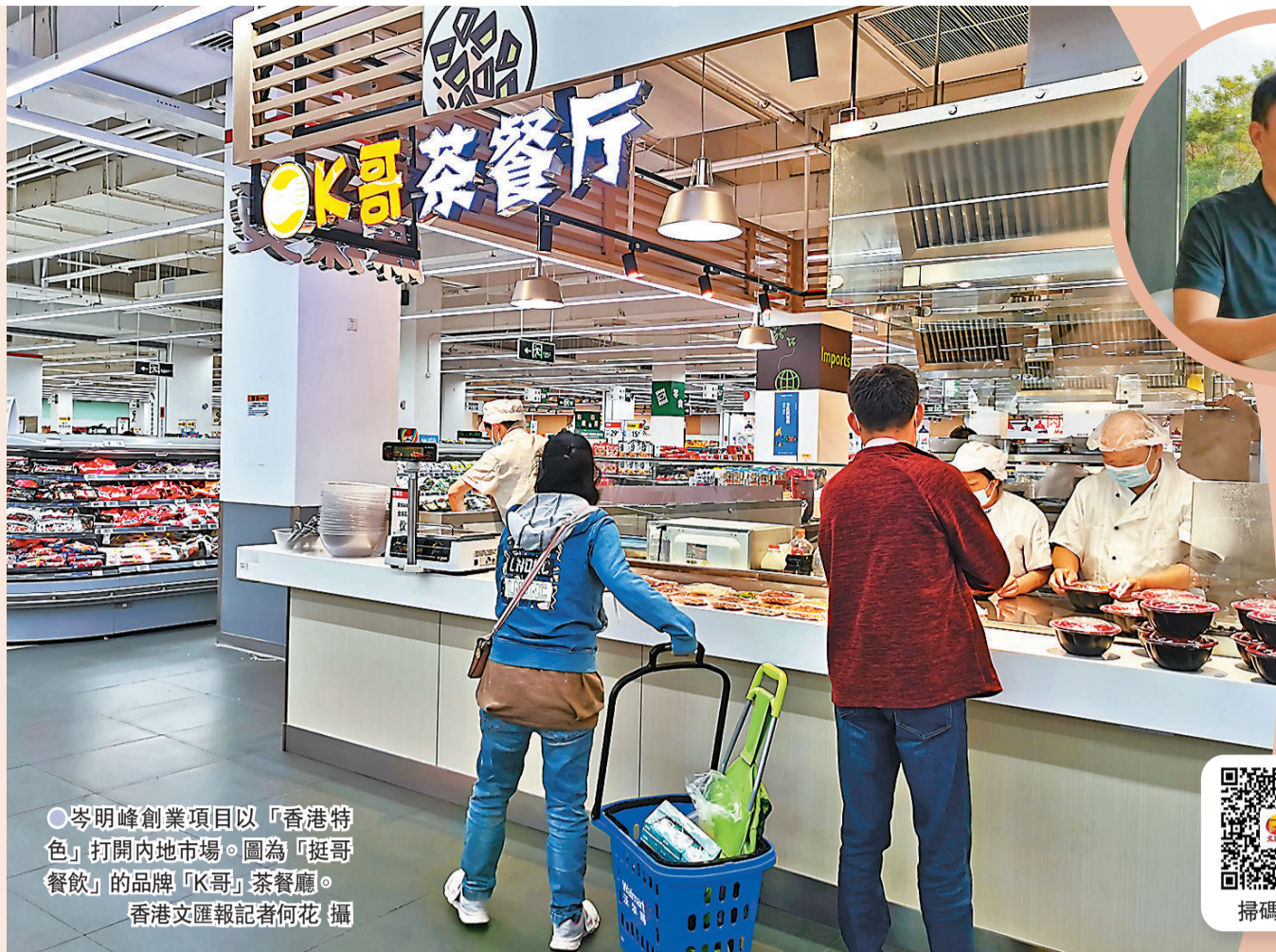
● 岑明峰創業項目以「香港特色」打開內地市場。圖為「挺哥餐飲」的品牌「K哥」茶餐廳。