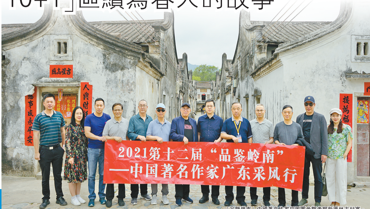
「品鑒嶺南」中國著名作家採風團參觀考察新厝林古村寨。

建設深汕合作區已是國家戰略 深汕合作區位於粵港澳大灣區最東端，西接惠州，東連汕尾，距離深圳60公里。1152平方公里海域波瀾壯闊，468.3平方公里陸地山、河、湖、溫泉、濕地匯聚，下轄原鵝埠、赤石、小漠、鮑門四鎮，客家、福佬、疍家、畚族等族群融合共生，歷史人文資源豐富。處於城市規劃中軸線上的「望鵬山」，寓意深汕合作區時刻不忘對標鵬城深圳，繼續發揚拓荒牛精神，加快推動新城開發建設。 深圳市深汕特別合作區黨工委、管委會自2018年12月16日正式揭牌，開啓了由深圳全面主導深汕合作區經濟社會事務的新篇章。2019年8月18日，《中共中央國務院關於支持深圳建設中國特色社會主義先行示範區的意見》明確提出「創新完善、探索推廣深汕特別合作區管理體制機制」。深汕合作區由廣東戰略上升為國家戰略，被賦予了新時代新使命。2020年10月11日，中共中央辦公廳、國務院辦公廳印發了《深圳建設中國特色社會主義先行示範區綜合改革試點實施方案（2020—2025年）》，專門明確要求「深化深汕特別合作區等區域農村土地制度改革」。 當前，深汕合作區正奮力建設成為粵港澳大灣區東部門戶、粵東沿海經濟帶新中心、深圳自主創新拓展區和現代化國際性濱海智慧新城。未來，這裏將是集聚最先進理念、最前沿科技的產業高地；生態優美、詩意棲居的生活福地；多元族群並存、文化交融薈萃的人文勝地。