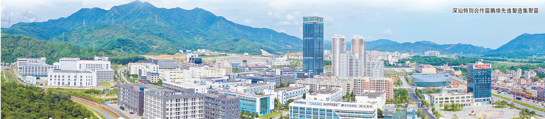
深汕特別合作區鵝埠先進製造集聚區