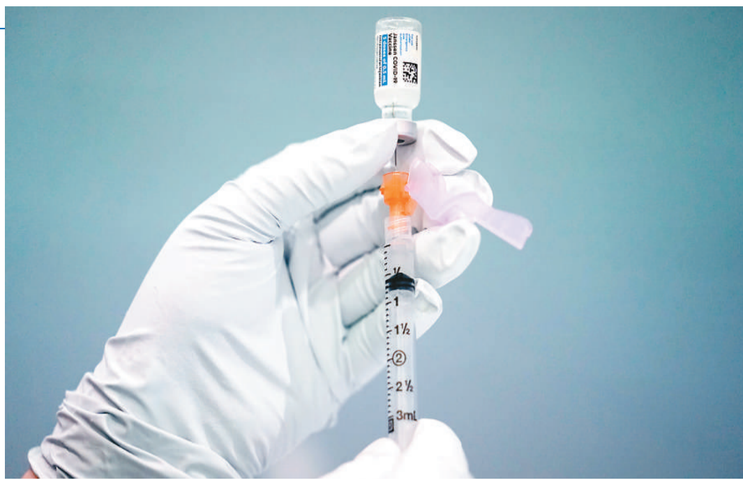
图为3月26日在美国费城拍摄的强生新冠疫苗。