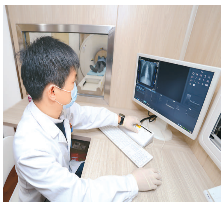
上图：3月17日，浙江省绍兴市中心医院医共体总院放射、胸外、呼吸、肿瘤等科室专家来到安昌分院，为当地居民群众开展肺癌筛查。