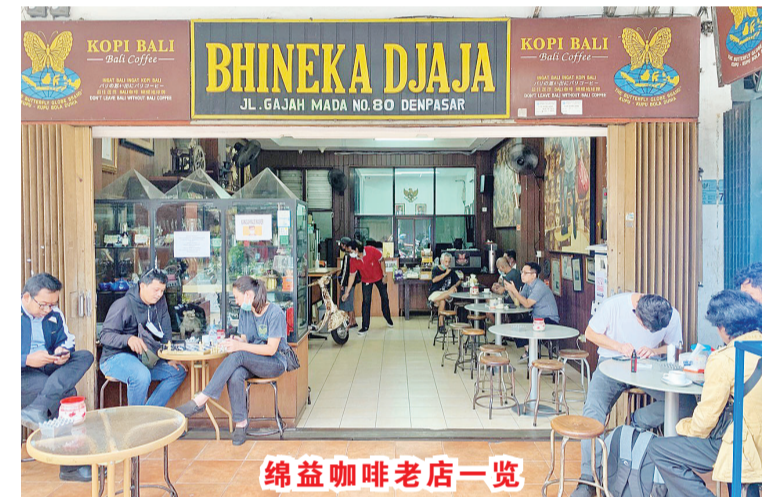
绵益咖啡老店一览