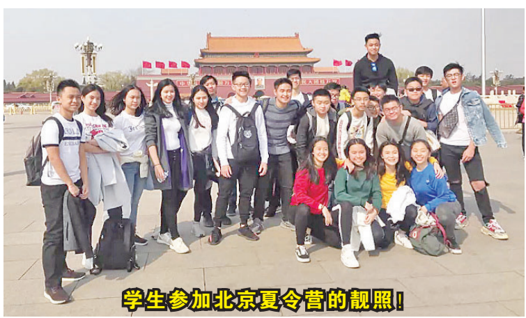
学生参加北京夏令营的靓照