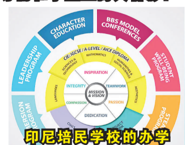
印尼培民学校的办学理念和教学系统

世界上很多国家的大学。多彩活动。培民学校注重搭建展示学生才艺特长的平台，营造积极向上、健康活泼的校园文化。开放日展示了奇妙的活动视频：联合国日、北京夏令营、台湾夏令营、澳大利亚夏令营、游学英国剑桥大学和、感恩家长日等精彩活动，这些极具仪式感的活动把平淡的日子变成了诗和远方。