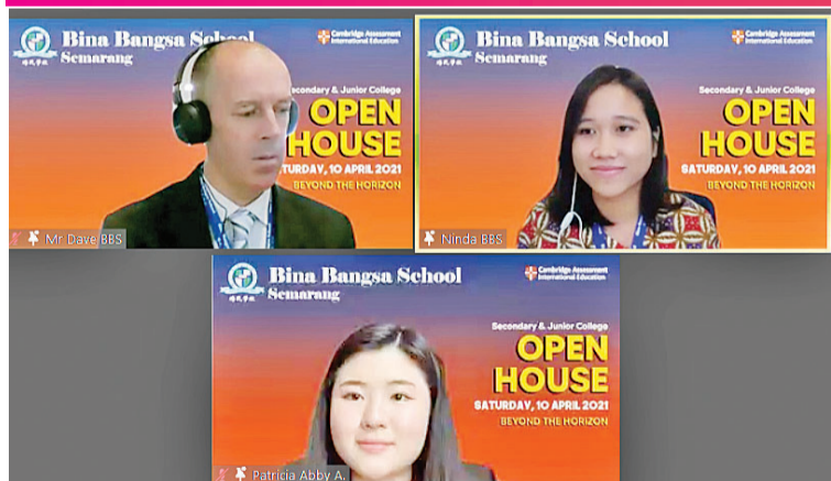
学校开放日的教师与学生主持人

【本报讯】为了让社会更好地了解学校的办学理念 and 教学体系，为了充分展示已毕业的培民学子的不凡成就，2021年4月10日，印尼培民学校三宝垄校区成功举办了“超越地平线”校园云开放日。