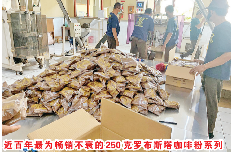
近百年最为畅销不衰的250克罗斯塔咖啡粉系列