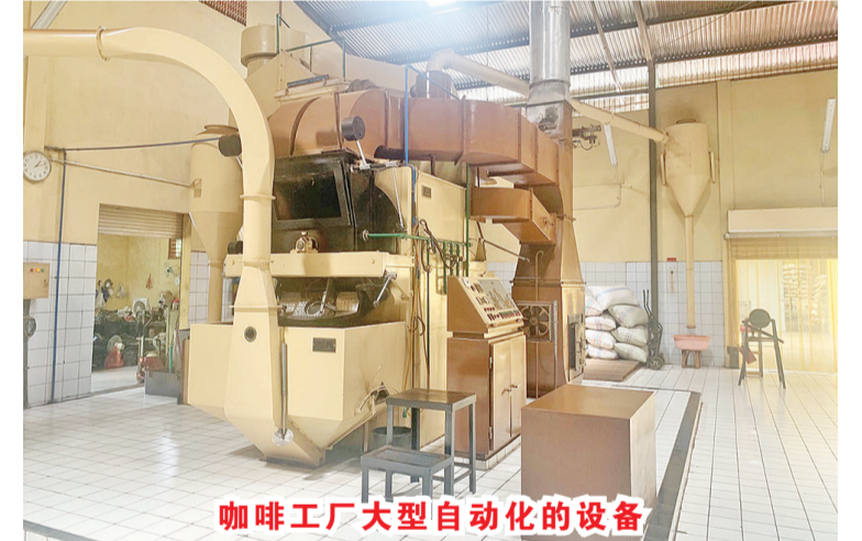
咖啡工厂大型自动化的设备