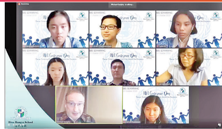
联合国日庆祝活动的领导们和学生主持人合影