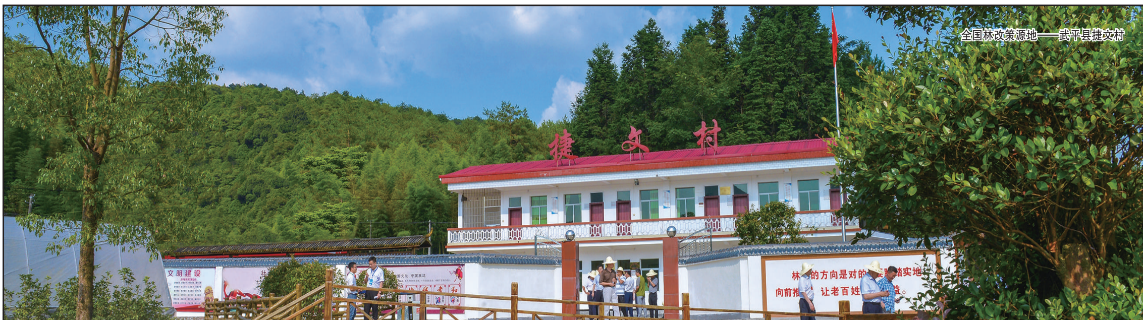
全国林改策源地——武平县建文村