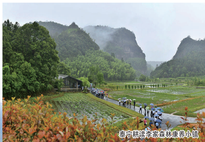
泰宁耕读李家森林康养小镇