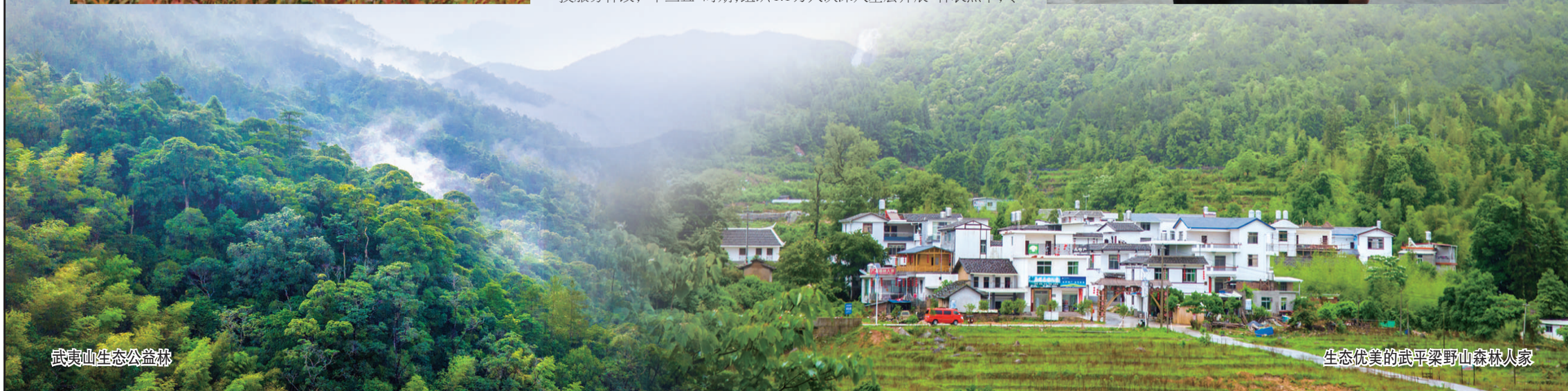
武夷山生态公益林