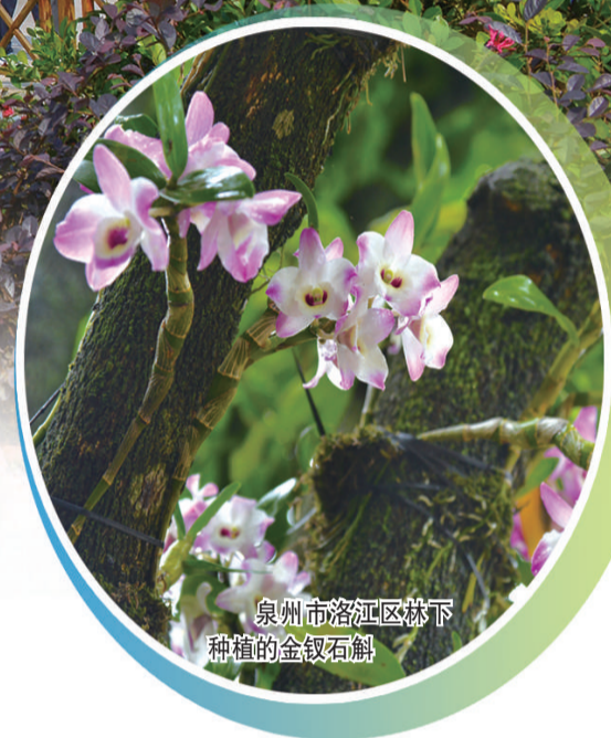
泉州市洛江区林下种植的金钗石斛

福建省位于东南沿海，素有“八山一水一分田”之称，全省林地面积1.39亿亩、占土地总面积76.08%，其中，近90%属集体所有，是典型的集体林区。 福建坚持“绿水青山就是金山银山”，实施集体林权制度改革，有力促进了林业发展、林农增收和林区和谐。 成就绿水青山，富裕万千林农，福建将继续深化集体林权制度改革，更好实现生态美、百姓富的有机统一，在推动绿色发展、建设生态文明上取得更大成绩。