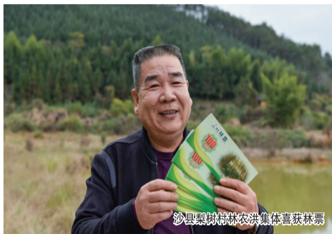
沙县梨树村林农洪集体喜获林票

福建林改实践提供了“福建样本”，全省9项可复制、可借鉴的改革经验作为国家生态文明试验区建设首批成果向全国推广。