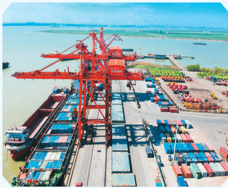
4月5日，江苏省如皋港，苏中国际集装箱码头港口机械正在吊装物资。

近期，国际货币基金组织、世界银行等国际组织纷纷上调今年中国经济增速预期，反映了国际社会对中国发展前景的坚定信心，成为外媒关注的焦点。