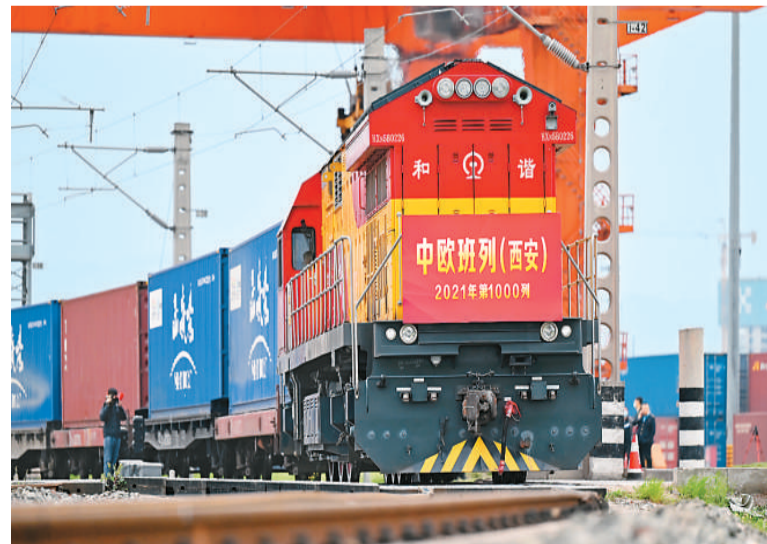
4月13日，X9041次中欧班列（西安）从陕西省西安市西安国际港站出发开往哈萨克斯坦。这是2021年陕西开行的第1000列中欧班列。

英国《金融时报》近日报道称，面对海路运输的集装箱短缺、高成本和延误等问题，中国制造商正寻求通过陆路出口商品。除了运输效率外，来自欧洲国家订单的增加以及“一带一路”倡议下货运路线的增加，同样推动了中欧班列货