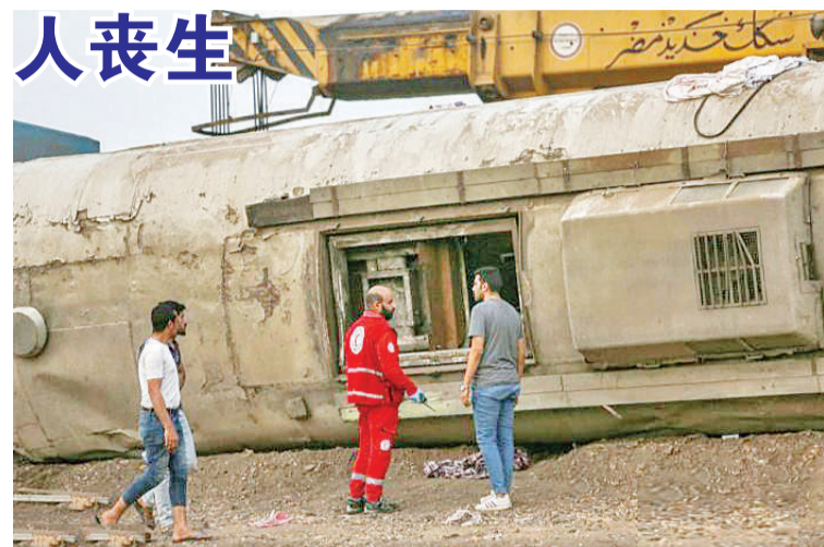
当地时间4月18日,一列客运列车从埃及首都开罗开往北部城市曼苏拉,途中在图赫市突然有4节车厢脱轨。

近期埃及火车事故频发,3月下旬,索哈杰省发生火车相撞事故,造成32人死亡,108人受伤。据检方宣布,事故是人为疏忽造成的。