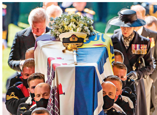
菲臘靈柩上蓋有他生前的軍帽。