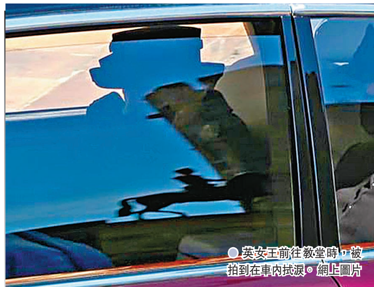
英女王前往教堂時，被拍到在車內拭淚。

英國菲臘親王的喪禮17日舉行，受新冠疫情限制，只有30名賓客出席，其間英女王伊利沙伯二世獨自一人就坐，王室成員也沒有致悼詞或發言。雖然白金漢宮事前已呼籲民眾不要前往溫莎堡外悼念，但仍有數百人到場，警方在溫莎堡附近一帶加強保安。