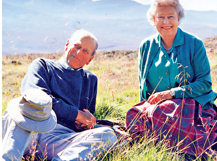
王室發布英女王與王夫最愛的合照。