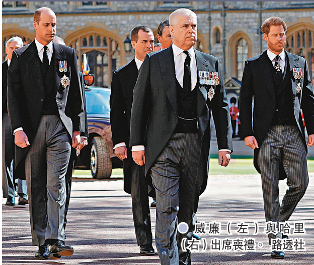
威廉(左)與哈里(右)出席喪禮。