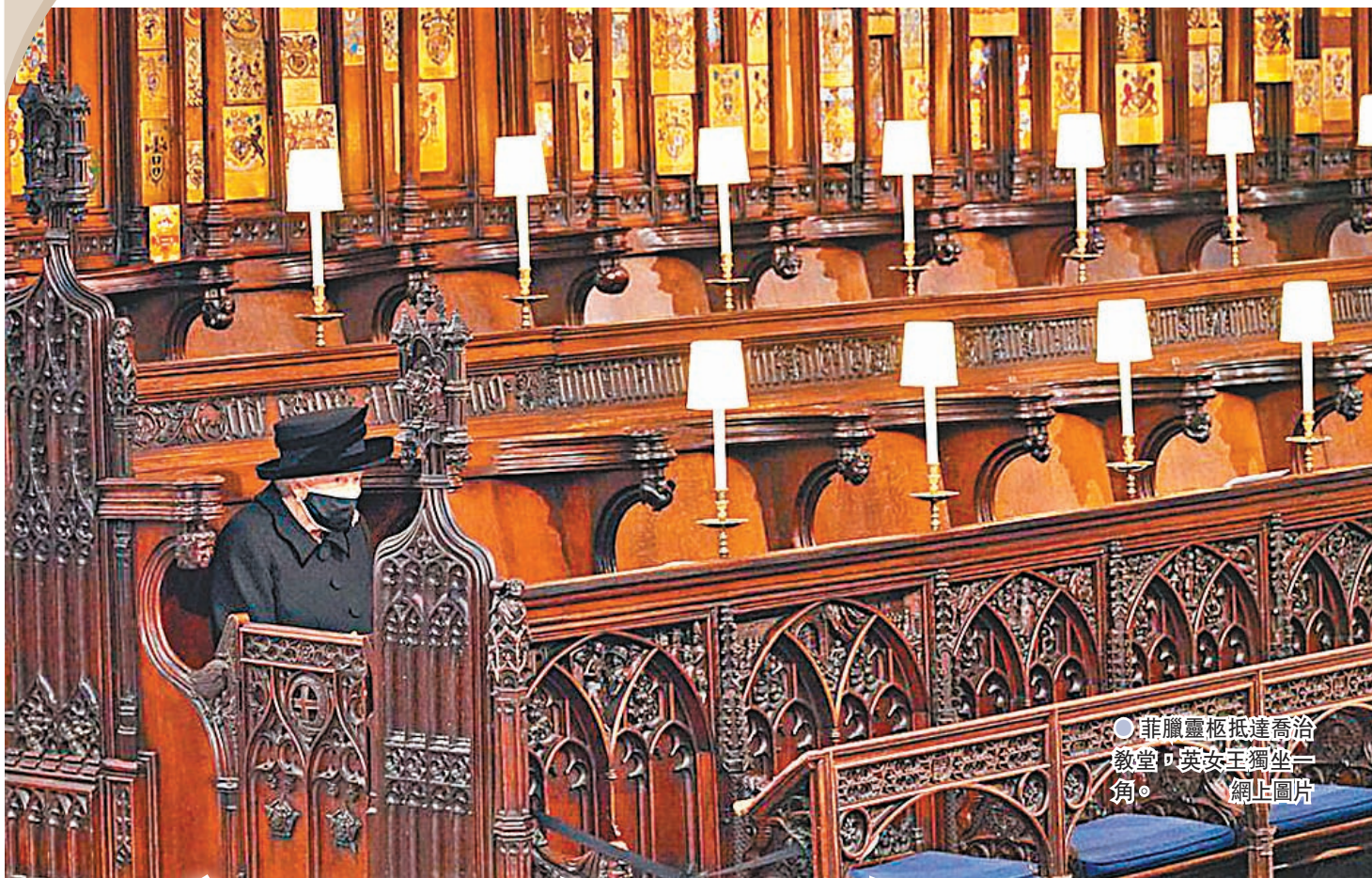
菲臘靈柩抵達喬治教堂，英女王獨坐一角。